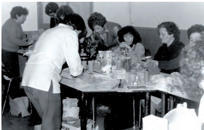
Curset de pastisseria a La Flor de Maig el 1981.