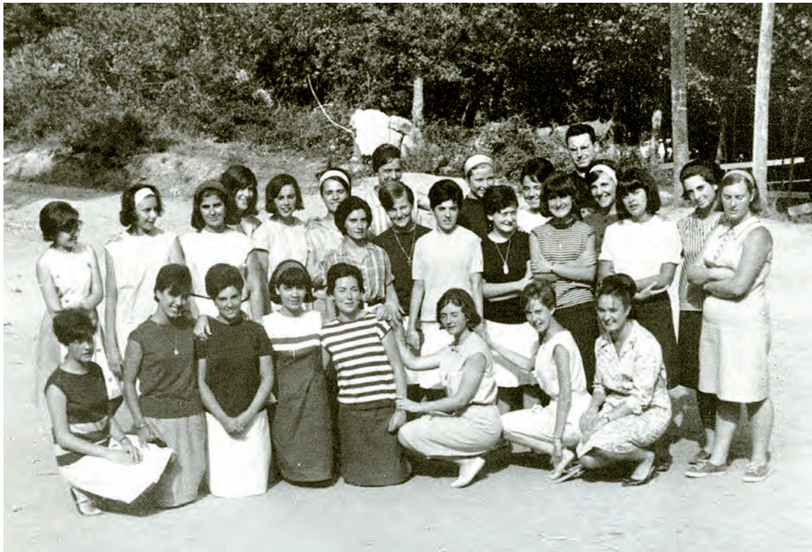
Penyafort 1964: el primer grup de noies del Poblenou que va anar a les colònies de la parròquia de Santa Maria del Taulat.

A principis dels anys seixanta, un grup de noies vinculades a les parròquies del barri van formar el Moviment Infantil i Juvenil, que actualment es coneix com a Esplai Movi.