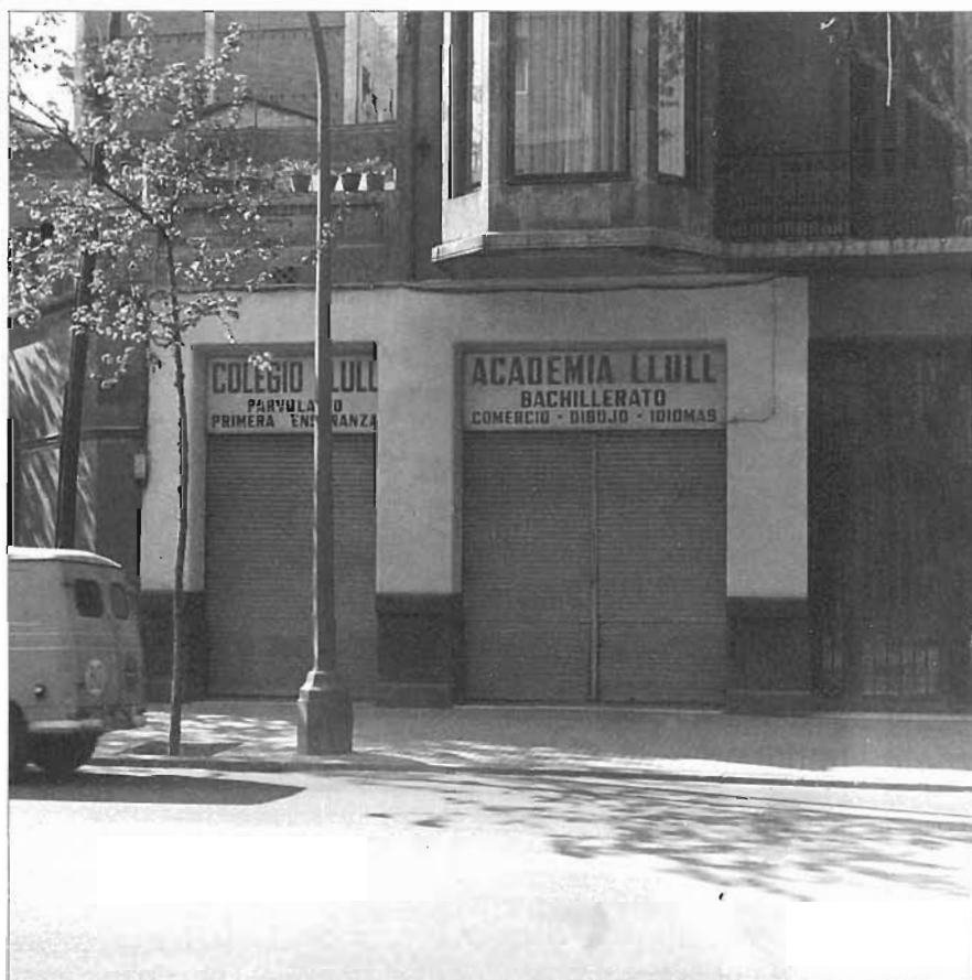
L'acadèmia Lull, una de tantes de la postguerra, 1973

cadèmies, per adaptar-se a les noves exigències de l'Administració, van millorar alguns locals, van cercar professorat més preparat, etc.