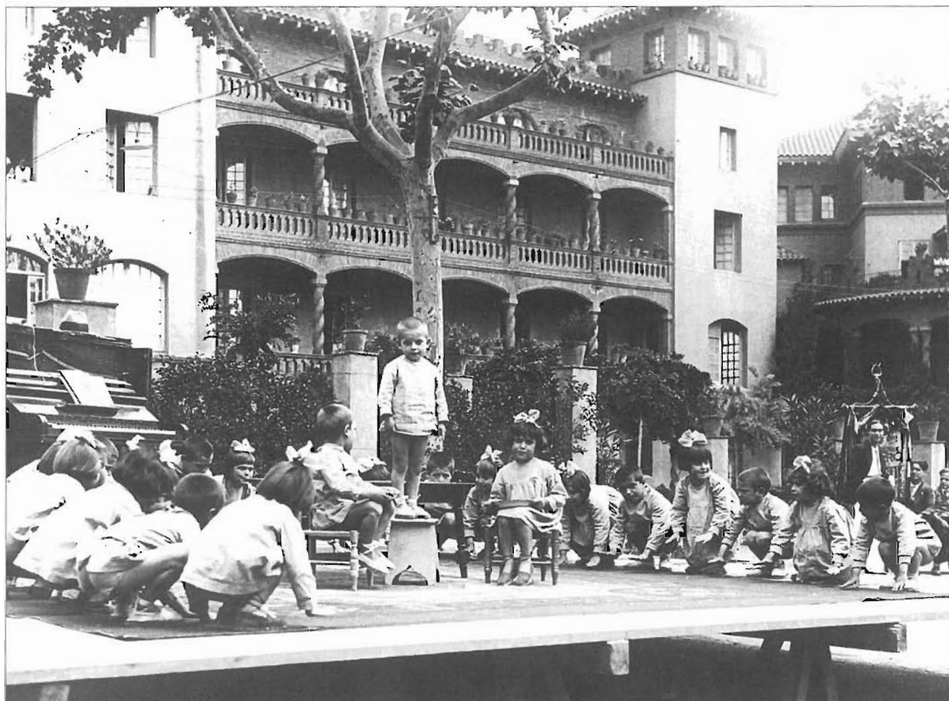
Una festa a l'antiga Protecció de Menors, el 5 de juny de 1932

s'instal·laven a la Rambla; el 1877, entre altres, hi havia una escola catolicoeclesiana elemental, al carrer Major del Taulat, número 53, baixos, amb una matrícula del voltant de dos-cents cinquanta alumnes; el 1879, una escola evangèlica de nenes, al carrer del Triomf, 129, amb cinquanta-