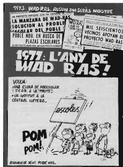
L'Associació de Veïns del Poblenou va fer un cavall de batalla del fet d'aconseguir el primer institut del barri als terrenys de l'antiga «Prote» (DIBUIX DE JONIA)

No es tracta simplement d'escolaritzar, fins i tot a les edats no obligatòries, de passar de la reivindicació quantitativa a la simplement qualitativa, sinó que, sobretot, es tracta de superar nous reptes que ja estan plan-