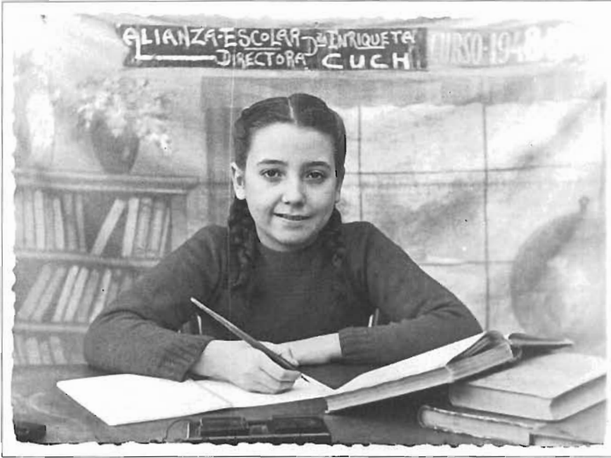
Una alumna de l'Aliança Escolar, curs 1948-1949

«Hem volgut donar a la nostra escola un ambient de llibertat [...]. El noi es troba bé a l'escola: surt de la classe i hi entra sense demanar permís, i enraona amb un company sempre que ho necessita [...]. És encoratjador veure que enmig d'una classe no hi ha ningú que usi aquesta llibertat [...]. Aquesta disciplina és el pol oposat a la de moltes altres escoles [...]. Heus aquí la nostra preocupació constant: és necessari buscar l'interès i posar-lo en l'escola en tot moment.» 15