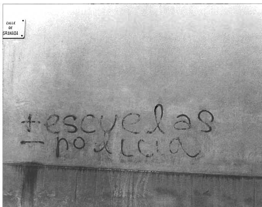
Una pintada que reclamava més escoles i menys policia, anys setanta

teiant els nouvinguts procedents de diferents continents, malgrat que al Poblenou d'avui, barreja de barriada obrera i de zona de residència d'un cert sector de la classe mitjana, no és una de les barriades amb problemàtiques que requereixen solucions més immediates.