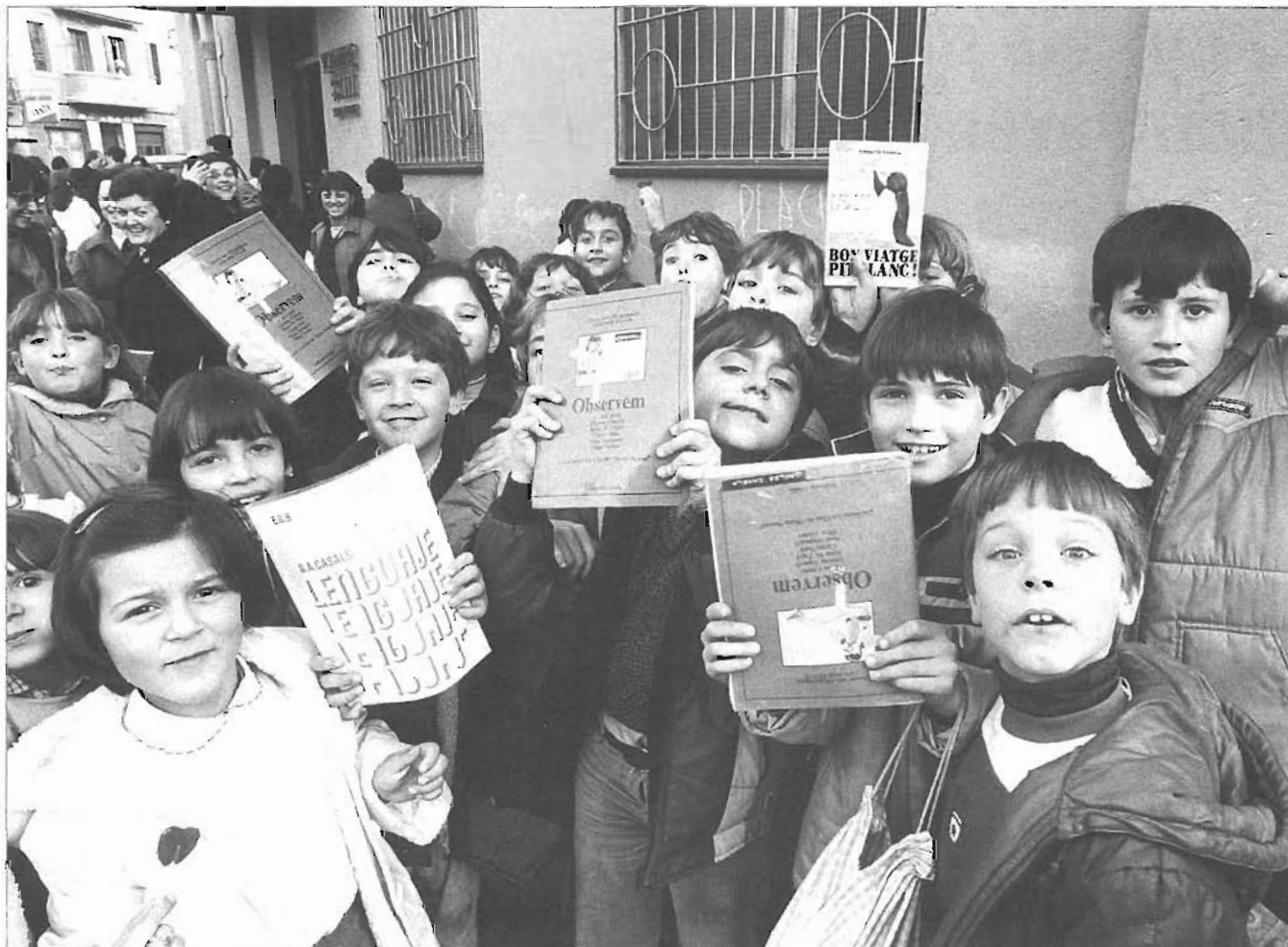
Alumnes a la sortida de l'escola Voramar

12. Els mestres feien classe una hora més i els pares pagaven unes quotes (permanències) per tal d'ajudar els mestres que cobraven salaris molt baixos. Aquestes permanències han durat fins no fa gaire.