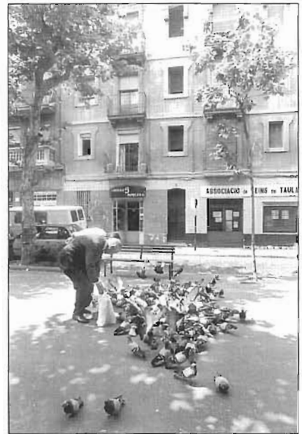
Seu de l'Associació de Veïns del Taulat abans de tancar

El Pla de la Ribera va sorgir principalment de la necessitat dels promotors de revaloritzar els terrenys ocupats en aquells moments per instal·lacions industrials, com ara la Catalana de Gas i Electricitat, La Maquinista Terrestre i Marítima, Crédito y Docks, Ford Motor