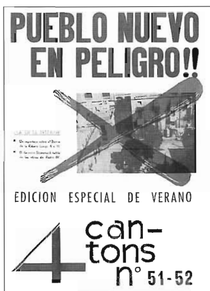
Portada del número especial de la revista quatre cantons

L'Associació de Veïns del Taulat, el Casino de l'Aliança i l'Associació de Propietaris, Comerciants, Industrials i Empleats Afectats pel Pla de la Ribera van lluitar per posar en alerta els poblenovins del risc que corria el barri i van realitzar un conjunt d'objeccions al Pla. 6, 7