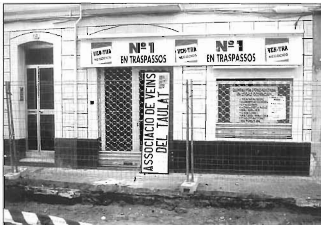
Últim local de l'Associació a la rambla del Poblenou cantonada Doctor Trueta