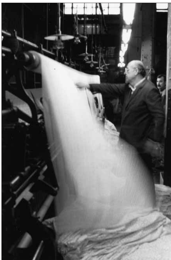
La Escocesa, en l'època de Blondas de Nottingham.