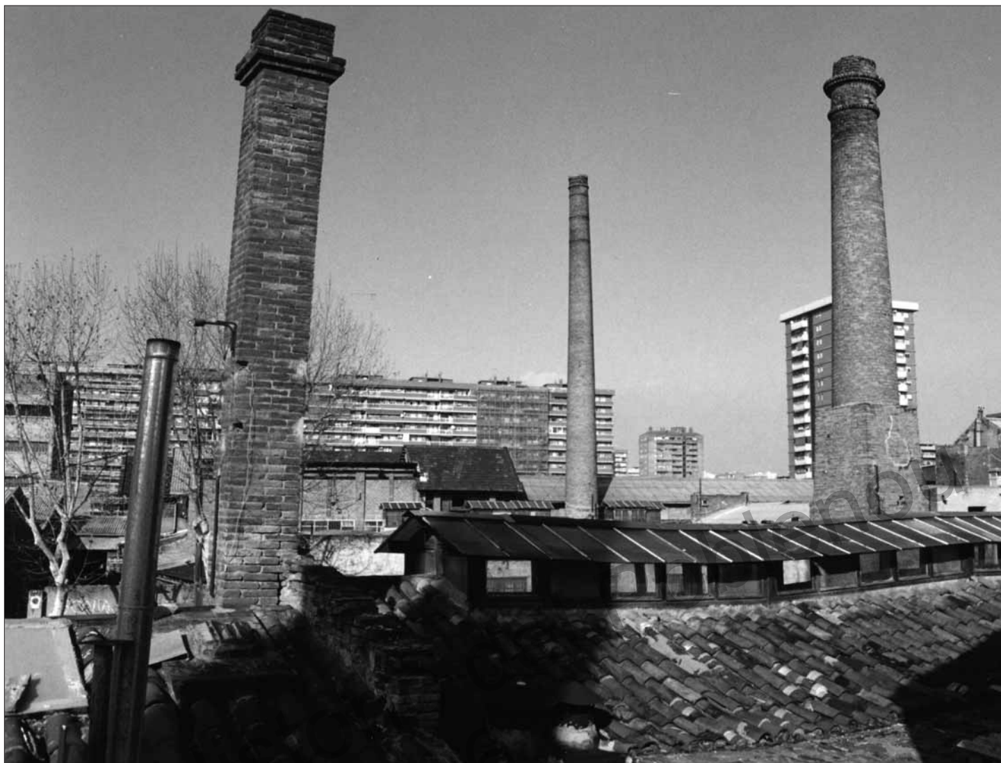
Estat actual de La Escocesa. Any 2006.