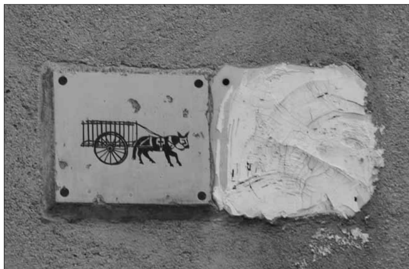
Placa del passatge d'Iglesias

Un altre veí del passatge són les Lejías Pons. El propietari, Ramon Pons, es dedica a la talla de fusta i explica, envoltat per les seves escultures de personatges populars, que d'aquí a dos anys celebraran el centenari de l'empresa, tot i que al passatge hi són des de fa uns trenta anys.