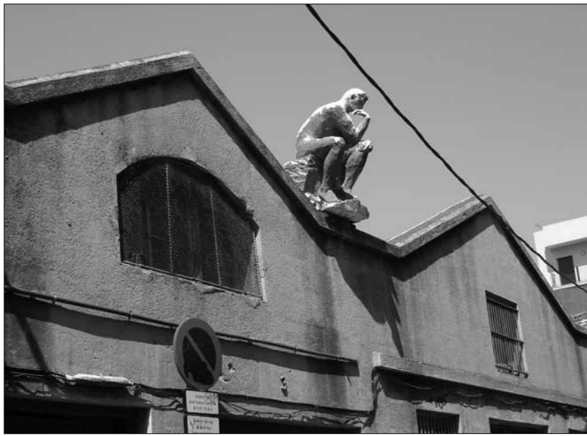
Passatge d'Olivé i Maristany. L'escultura del pensador que presideix un edifici del passatge de Maristany és de porexpan: «Va ser feta per uns nois que confeccionaven maquetes i decorats per a teatre i que treballaven molt per al grup teatral La Fura dels Baus. Però van marxar, i el pobre pensador està ronyós de la pluja.»

hores. «De vuit del matí a vuit del vespre, dissabtes inclosos, i amb una hora per dinar al migdia», aclareix. «Aleshores tothom s'emportava una carmanyola», explica. «I la fàbrica de L'Alquitrà feia un tuf...», comenta arrufant una mica el nas.