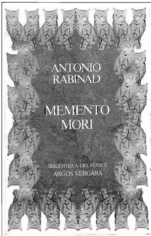
La novel·la Memento mori d'Antonio Rabinad ha esdevingut, sense pretendre-ho, un document de l'època.