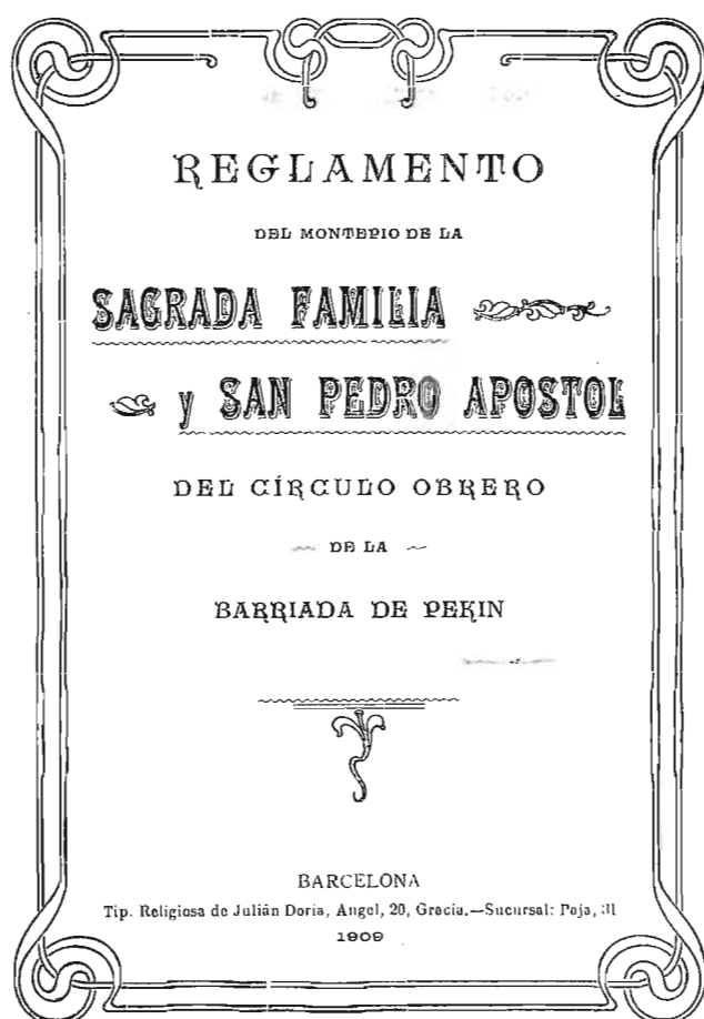
Reglament d'una societat benèfica instal·lada al barri del barri de Pekín. 1909. AMDSM

Maria del Taulat, el 15% dels feligresos mor sense rebre els últims sacraments, només un terç va a missa, "y se puede calcular en menos de tres mil personas los que cumplen el precepto pascual, existiendo en el pueblo bastantes escándalos de públicas mancebías". En la visita pastoral del 1884, el bisbe demana al rector de Santa Maria del Taulat que procuri consolidar el catolicisme i la influència del rector en totes les esferes socials. Per aconseguir aquest objectiu, el rector ha de predicar