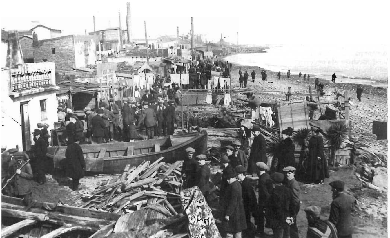
Visita de les autoritats al barri de Pekín després d'haver patit els efectes d'un temporal. A. Merletti, 1911. AFC

s'incorporava al treball, se l'havia de protegir contra les males companyies que l'intentarien corrompre. L'home que es pretenia aconseguir no seria "uno de esos monstruos engendrados en los antros del anarquismo", sinó un treballador honrat, un marit fidel, i un pare afectuós.