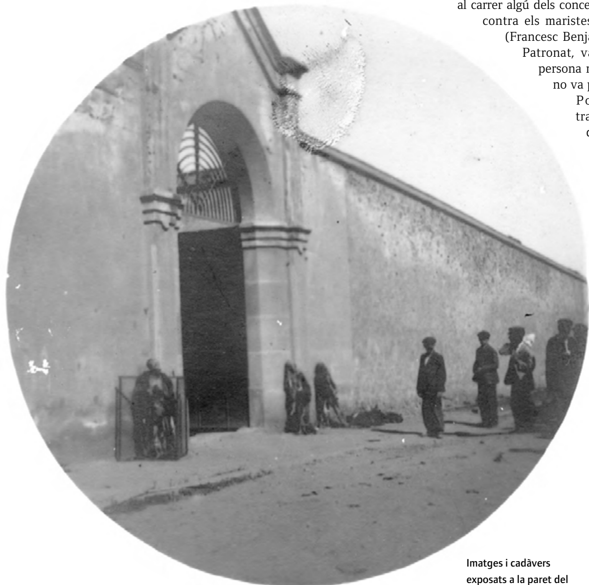
Imatges i cadàvers exposats a la paret del Cementiri del Poblenou.