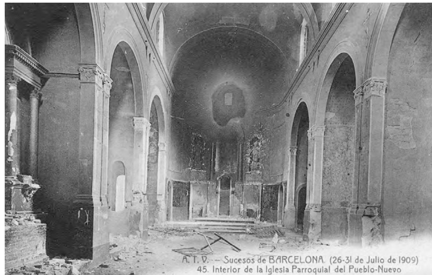
A. T. V. — Sucesos de BARCELONA. (26-31 de Julio de 1909) 45. Interior de la Iglesia Parroquial del Pueblo-Nuevo