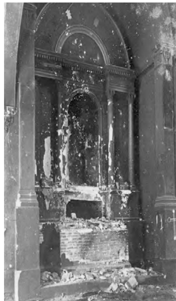
Altar lateral de l'església de Santa Maria del Taulat cremat.

Poc després de la mitjanit del dilluns 26 de juliol, l'empat —vaguistes contra autoritats— quedà desfet amb l'incendi d'una escola dels germans maristes. Una vegada més, els obrers del Poblenou van servir com a catalitzador. L'agència a través de la qual foren mobilitzats era el Centre Radical, que acollia un grup actiu de la Joventut Radical, com també una escola racionalista estretament vinculada a Ferrer i Guàrdia. I allà és on s'originà la idea d'«embestir a la gente de iglesia».