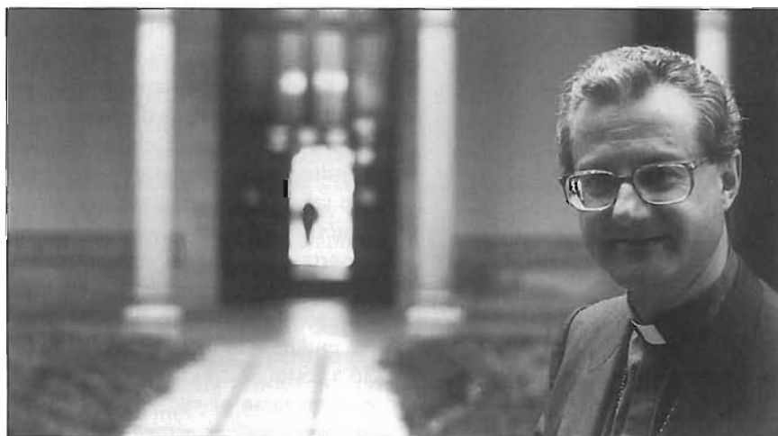
El bisbe Vives a la seu de l'arquebisbat de Barcelona.

— I també als capellans. És una gent que respon al model de la gent