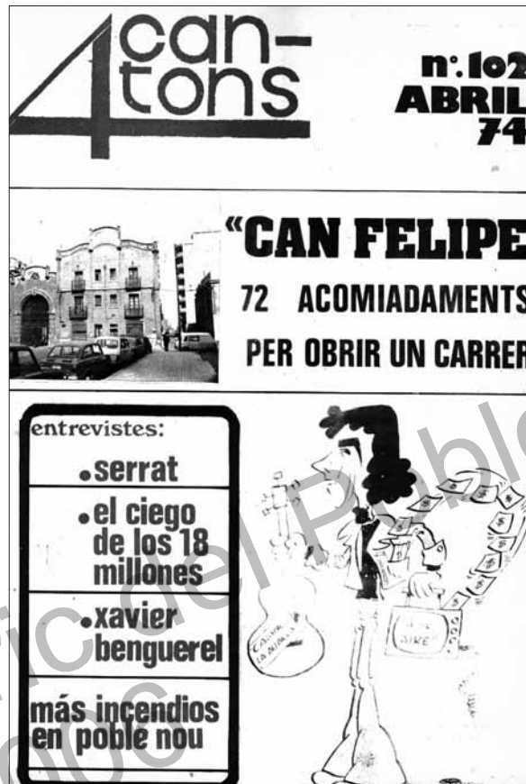
Portada de Quatre Cantons anunciant l'acomiadament de 72 obrers de Can Felipa per obrir el carrer de Pallars. Fou l'inici del final de Catex.

Els conflictes laborals estudiats en el treball responen a dues grans motivacions: la consecució de millores en les condicions laborals (materials, horàries, higiene, accidents, etc.) en un context de dictadura militar en crisi i de canvi polític, i la defensa