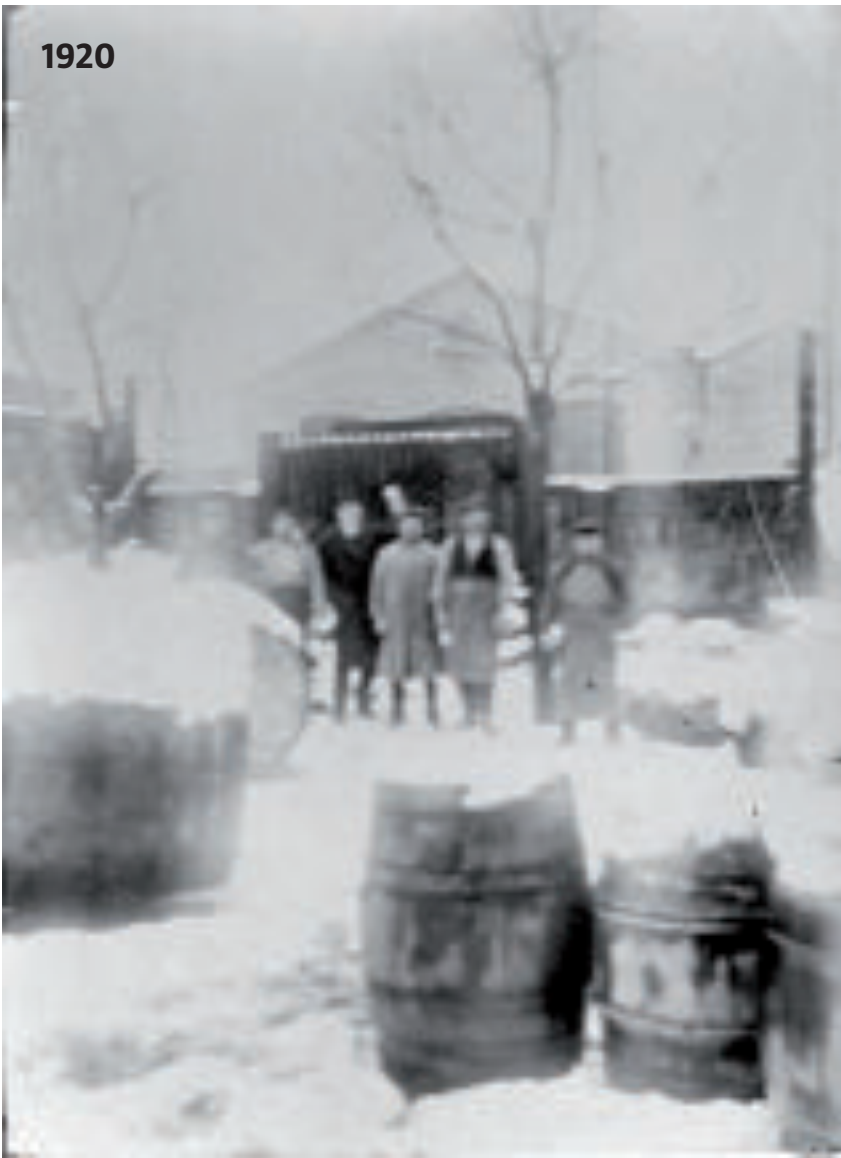
Magatzem del vermut Ticiano. Estava al passeig del Cementiri, avui avinguda d'Icària, prop del pas a nivell.