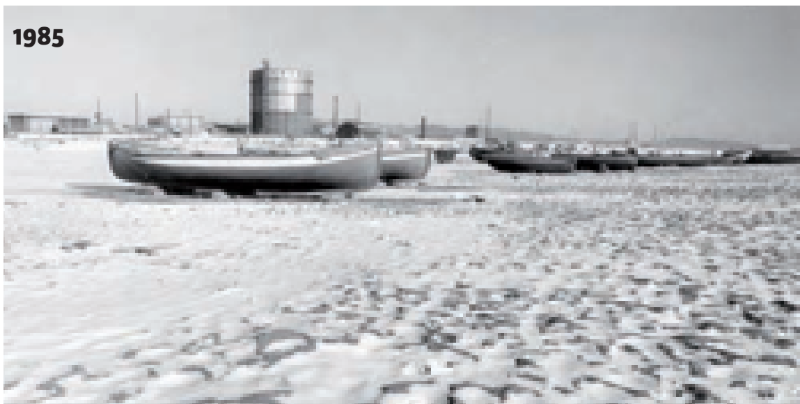
La platja de la Mar Bella. A la imatge de dalt es veu el Gasòmetre, i més a l'esquerra, la xemeneia de Can Girona. A la de sota, els blocs del passeig de Calvell i les palmeres plantades per configurar un zona d'esbarjo a la platja.