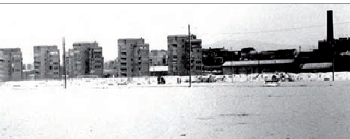
La platja de la Mar Bella, amb els blocs del passeig de Calvell al fons.