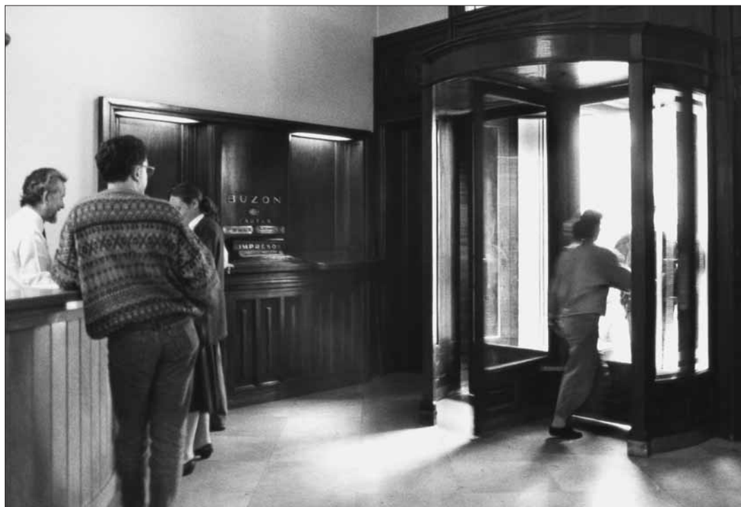
El vestíbul del carrer Pelai.

talleres de Pueblo Nuevo en ese sentido es muy grave». 9