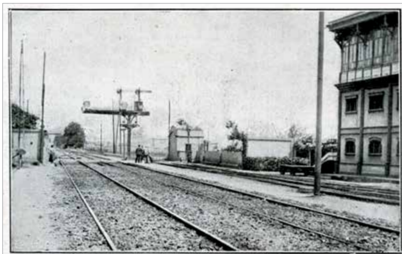
Sitio de la estación de Barcelona donde fue asaltado el tren obrero que se dirigía a Pueblo Nuevo, por una cuadrilla de ladrones que robaron una caja que contenía 149.000 pesetas