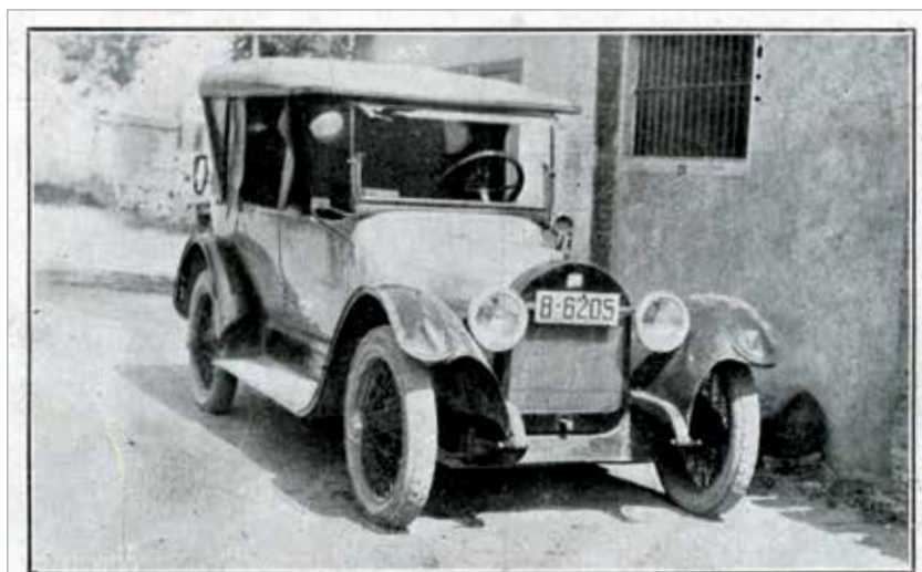
El automóvil blanco en el que los ladrones huyeron perseguidos por varios soldados, que dispararon sobre el coche, matando a uno de los criminales