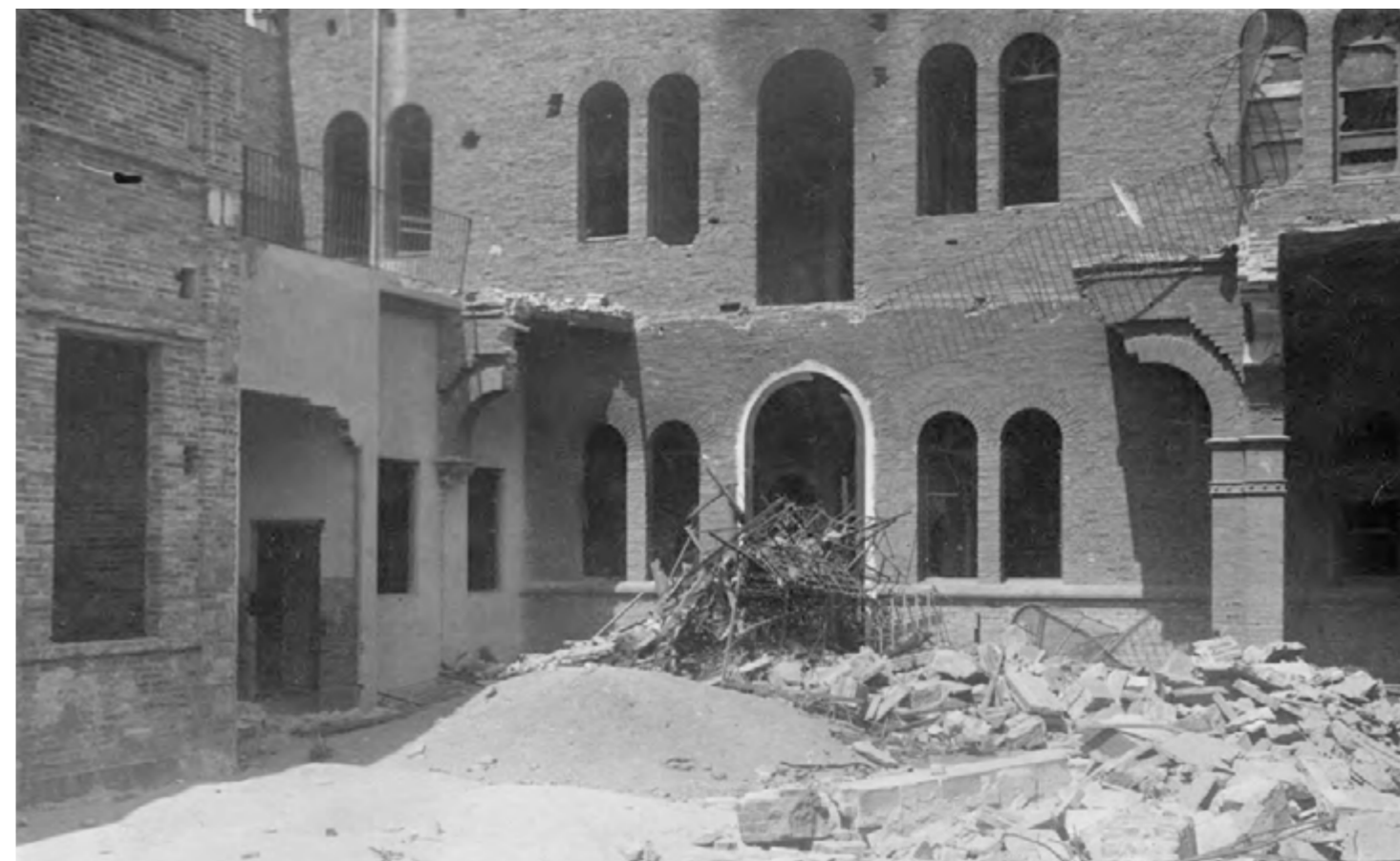
El pati del convent de les monges en runa. Un dels 49 edificis religiosos de Barcelona afectats pels incendis.

A. T. D. — Sucesos de BARCELONA. (26-31 de Julio de 1909) 2 43. Convento de Franciscanas. Celdas. Pueblo-Nuevo