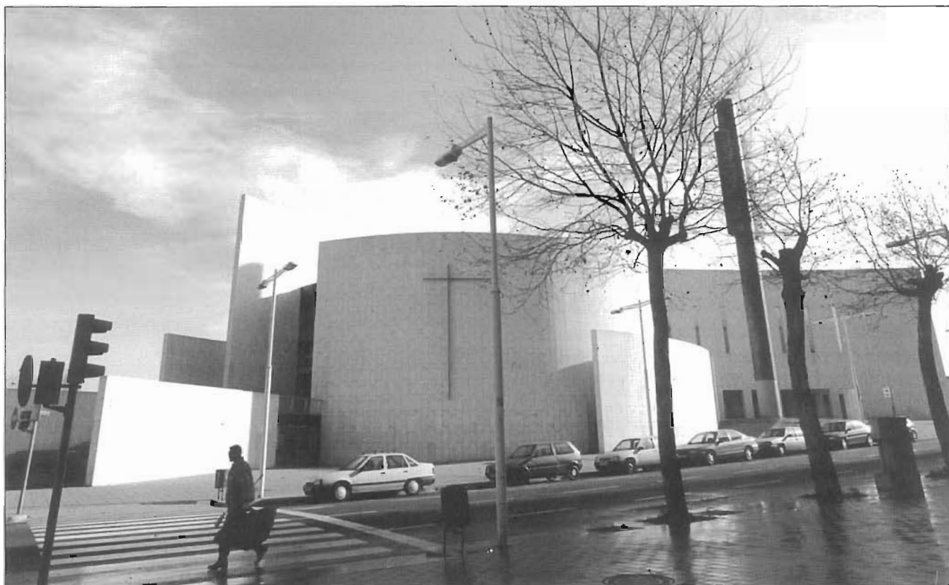
L'església d'Abraham inaugurada durant els JJOO de l'any 1992

temporalment i això nou d'ara s'està fent amb paràmetres més de mercat, més espontanis, i ja veurem què en sortirà. Ara, anar al Poblenou és una sorpresa diària, i jo hi vaig sovint a veure els meus pares.