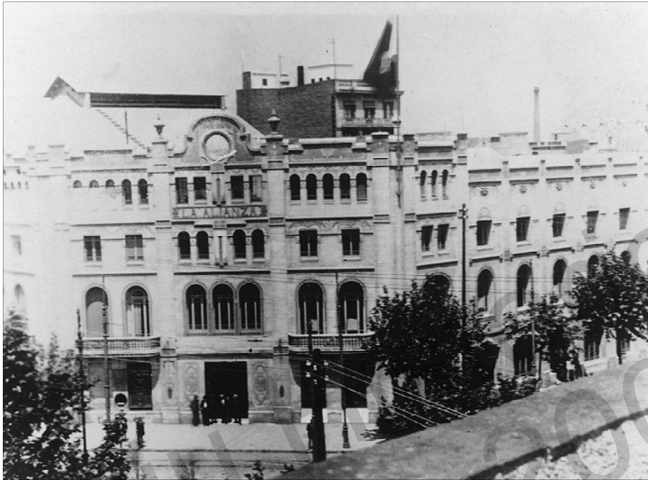
La societat 'Aliança al carrer de Wad-Ras (actualment Doctor Trueta) cantonada Rambla.