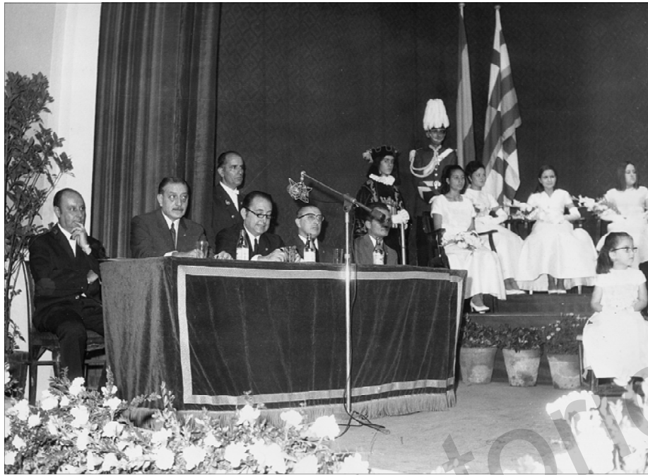
Jo es Florals al Casino l'Aliança. 8 d'octubre de 1969.