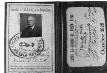
Títol de soci de la Societat l'Aliança del Poble Nou. Any 1929.

amb l'empresa Odeon va anar seguit d'altres acords, que van ajudar l'economia del Casino durant molt de temps. Llogar el local es va revelar com una bona solució.