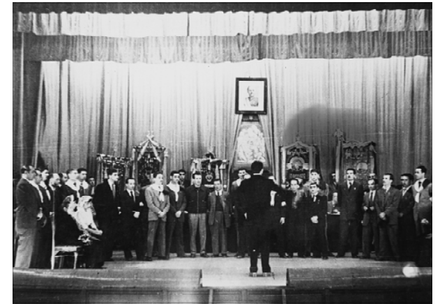
Homenatge a la vellesa de La Caixa al Casino l'Aliança. Any 1940.

vien de deixar el local i va posar el cas en mans dels jutges. 2 Les reunions socials les van celebrar des d'aleshores a l'Ateneu Colón.