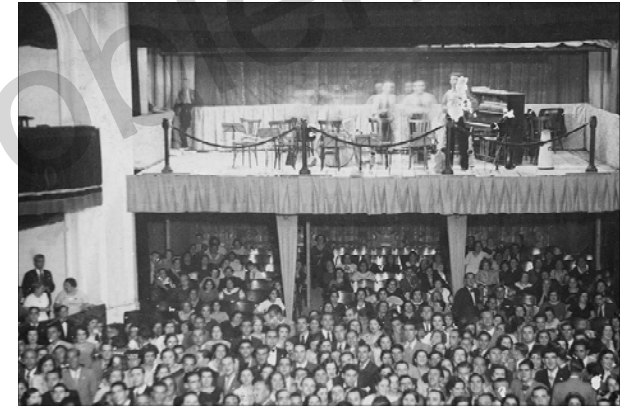
Ball a l'Aliança al carrer de Wad-Ras. Anys trenta.