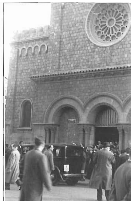
Santa Maria, anys cinquanta