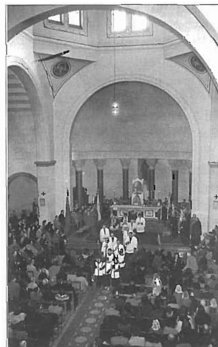
Interior del temple de Sant Francesc