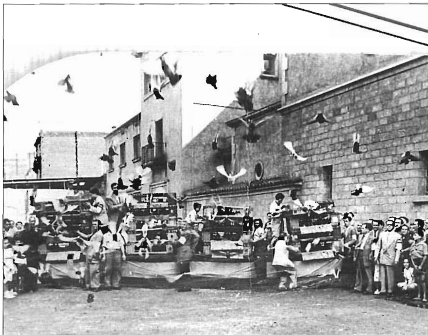
La Societat Colombòfila deixa anar coloms amb motiu de la Festa Major de 1951, davant el nou temple de Santa Maria