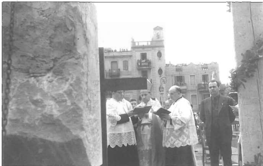
Primera pedra de Santa Maria del Taulat, posada el 20 de juny de 1945 (CARLOS PÉREZ DE ROZAS)

Les arrels de Santa Maria del Taulat són les més profundes del nostre barri i de fet corresponen a un rebrot de l'antiga parròquia de Sant Martí de Provençals, que, al voltant de l'antic municipi de Sant Martí, va anar veient com creixien els altres futurs municipis –i després barris– del Clot, la Sagrera, Poblenou i la Muntanya (del