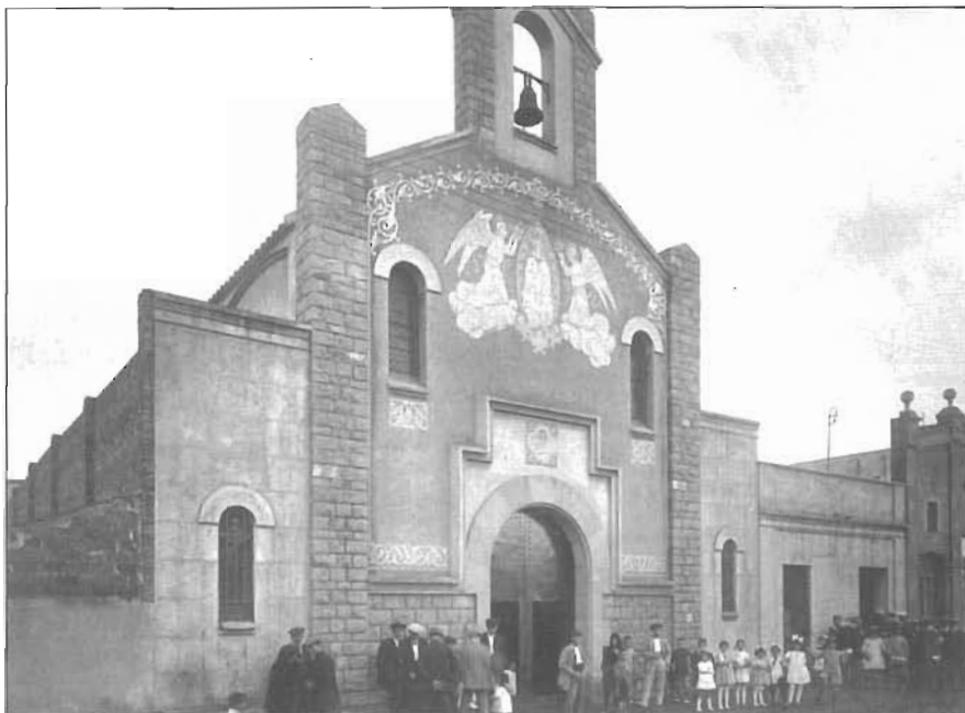
Antiga església de Sant Francesc d'Assís, anys trenta