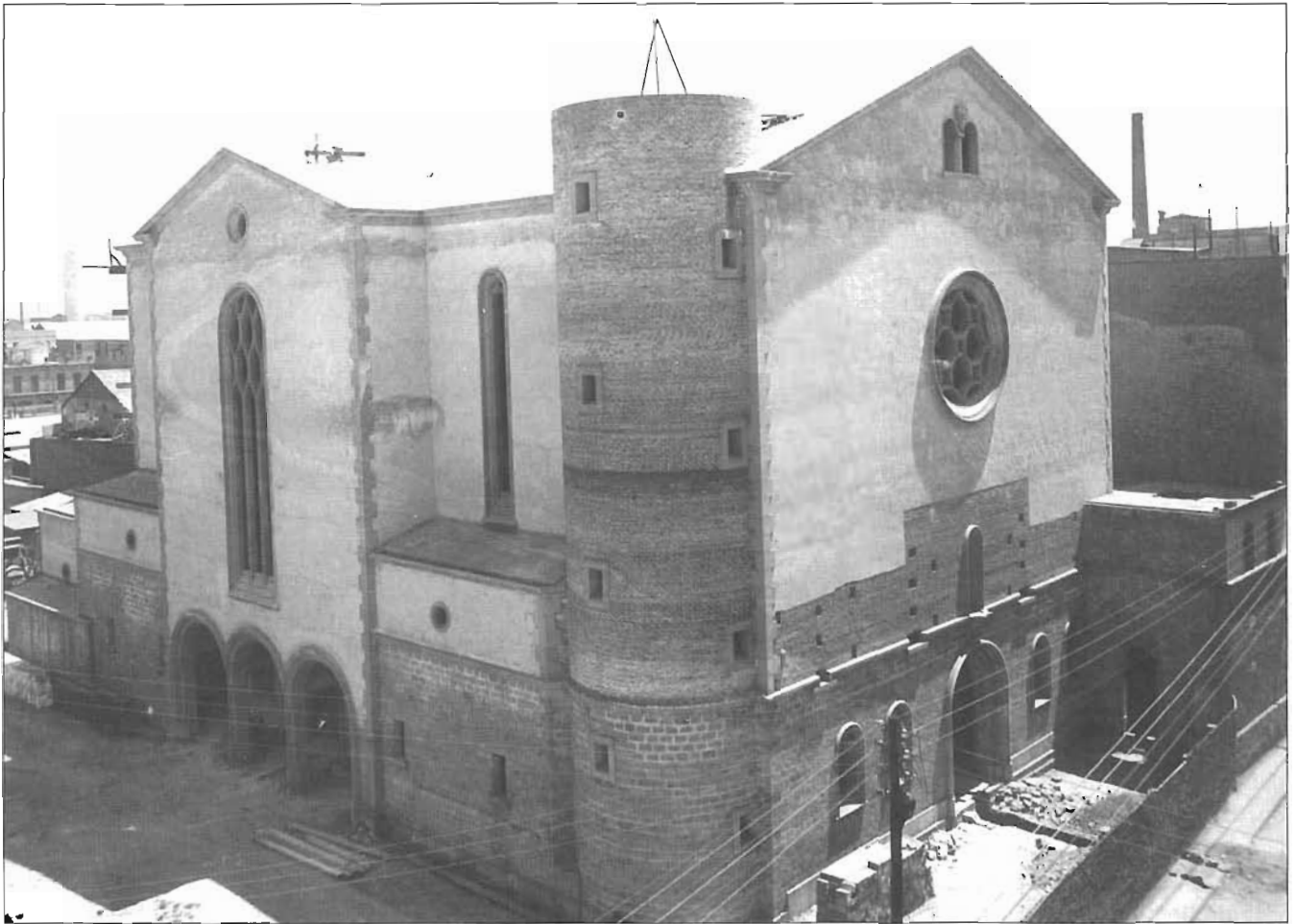
Santa Maria del Taulat en reconstrucció, 1949