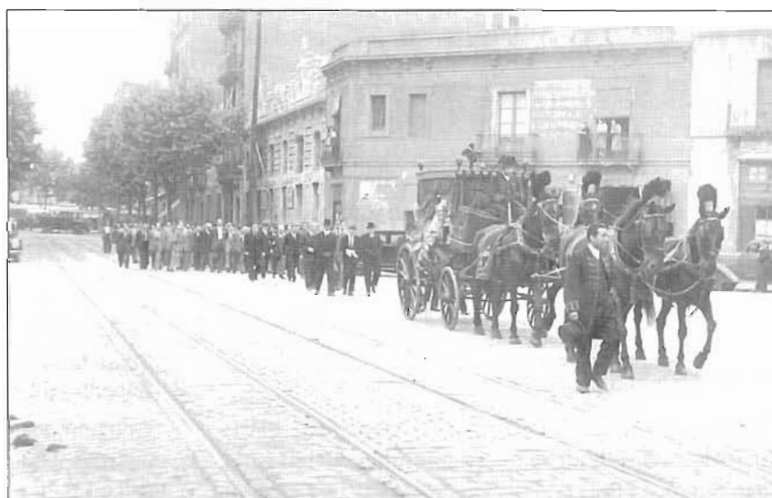
Al carrer de Doctor Trueta, a l'alçada de Llacuna, es pot veure l'edifici que havia estat de la Lliga i on durant els anys quaranta i cinquanta es trobava l'Hogar Productor de Educación y Descanso. Ara hi ha l'Institut de Formació Professional Poblenou.