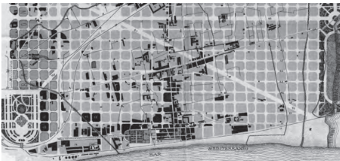
Plànol de Sant Martí de Provençals de l'any 1882, on es pot apreciar que la ciutadella ja ha estat enderrocada i el passeig del Cementiri està plenament consolidat.