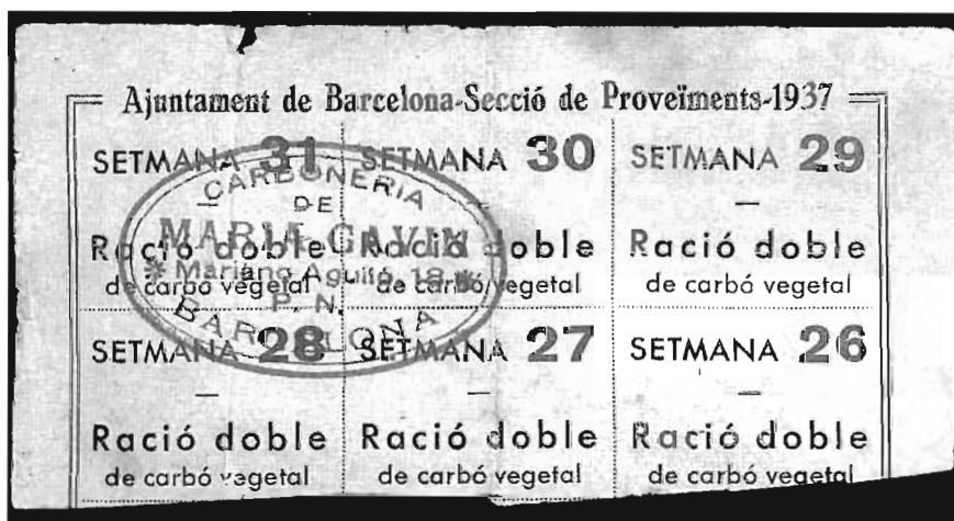
Racionament del carbó durant el règim franquista