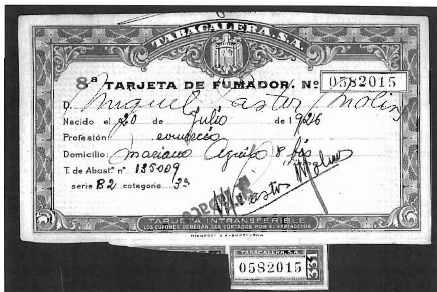
Cartilla de racionament del tabac que només podien tenir els homes.

Ple, però ens van agafar. L'especialitat del Cànem eren les pallisses. Jo he vist morir un home, un home boig de la Barceloneta, que havia