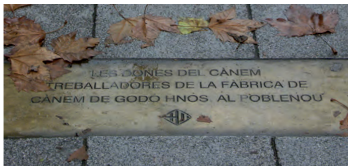
Placa que es va col·locar el 1999 a la rodona de la Rambla amb Lluç per recordar les treballadores de la fàbrica del Cànem.

«Vers l'any 1900, la segmentació sexual del treball mantenia els sectors més qualificats i més ben pagats en mans dels homes, com passava a la tintoreria i als acabats del tèxtil cotoner —l'anomenat ram de l'aigua —, mentre que la filatura estava en mans de les dones supervisades per contramestres i vigilades per capatassos i majordoms, tots homes... Solien estar absents de les juntes directives de les societats obreres de resistència d'aquells rams en què eren majoritàries», ha escrit Albert Balcells a l'obra Les dones treballadores a