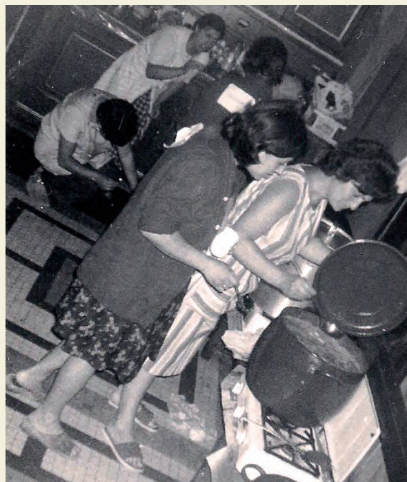
La tanca de dones de Motor Ibérica a la parròquia de Sant Andreu el 1967.