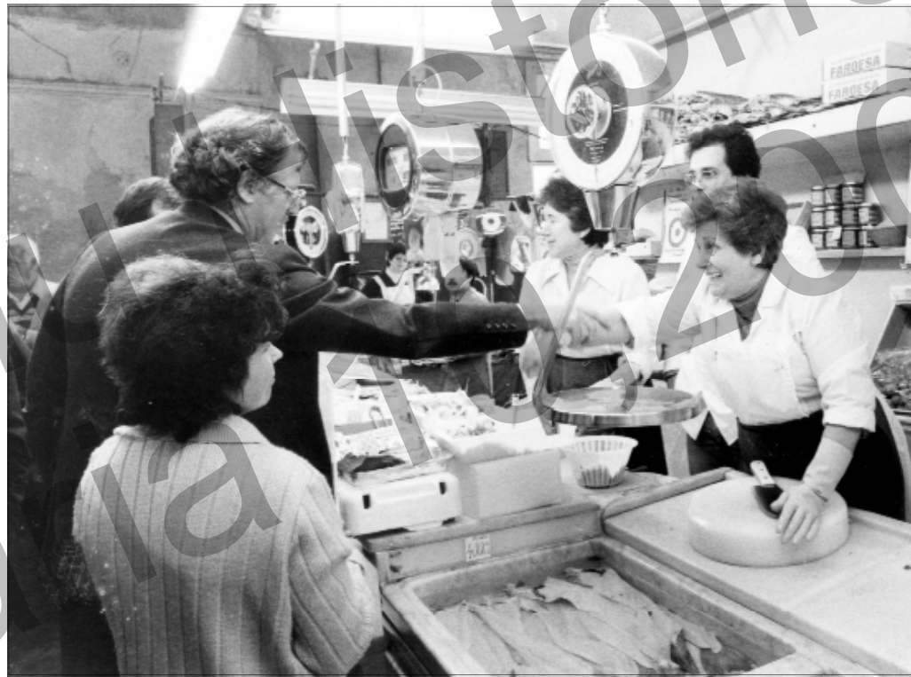
Els botiguers disfressats per Carnestoltes. 1990

mateix arquitecte, Pere Falqués i Urpí (1850-1916), l'arquitecte municipal de Sant Martí de Provençals. De fet, ambdós mercats són bessons i foren construïts a les darreries de la independència de Sant Martí com a municipi, atès que la polèmica annexió a Barcelona fou el 1897. Per tant, la iniciativa de obrir els mercats sorgí del que en aquell moment era l'Ajuntament de Sant Martí de Provençals (ara casa de la vila), com també la concessió de permisos i el control sanitari dels aliments.