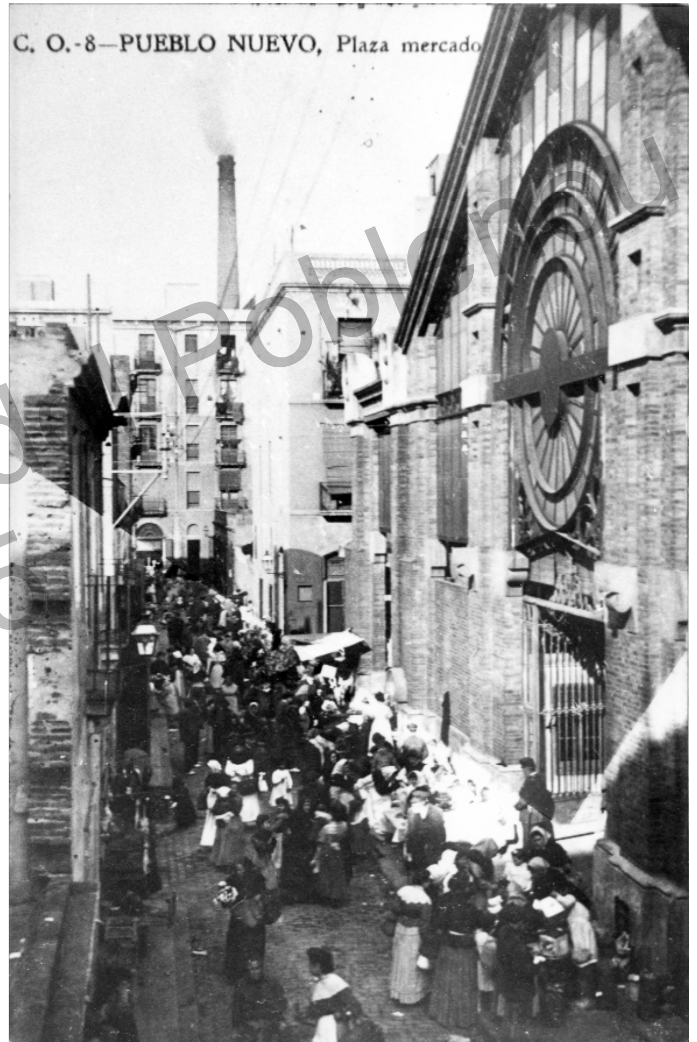
Gent al voltant de la façana principal de la plaça del Mercat. 1909