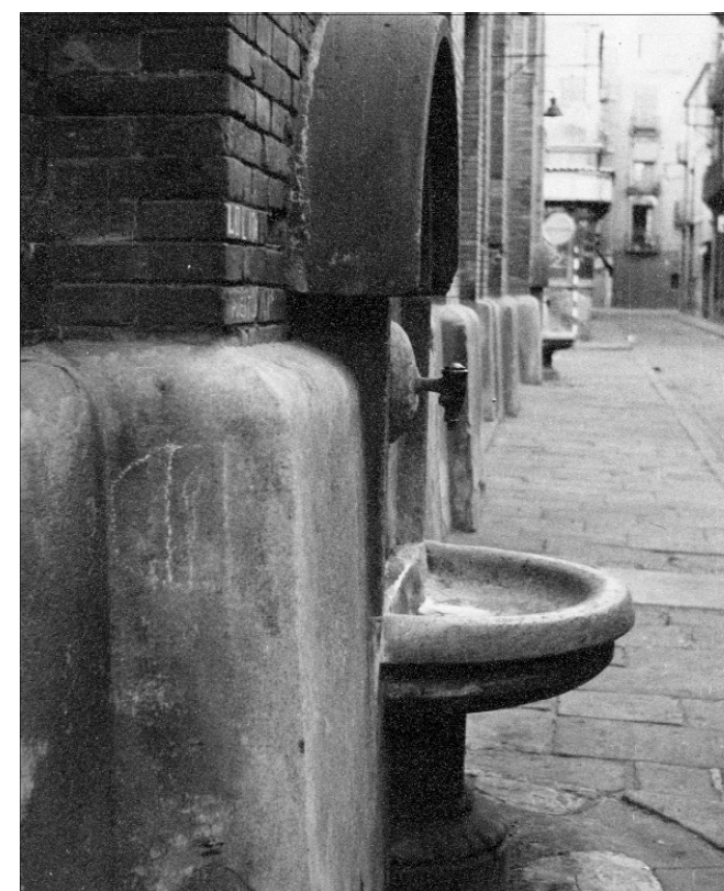
Detall escultòric al·legoria del mercat. PERE PARERA

E ls mercats coberts tenen el seu origen en els mercats a l'aire lliure, situats en places o bé en nuclis comercials tradicionals com ara la zona del Born, o bé extramurs com ara el mercat de la Boqueria, on es coneix activitat comercial des de mitjan segle XVIII. De tota manera, no fou fins al segle XIX que es van començar a cobrir els mercats: el primer exemple el trobem amb el mercat de Santa Caterina (aixecat sobre les restes del convent del mateix nom) el 1844, i el del Born, el primer aixecat en clau modernista.