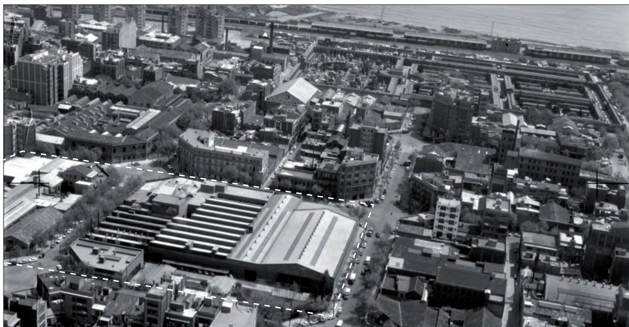
En aquesta fotografia de l'any 1970 es veu, dins l'àrea perimetrada, a la dreta els tallers de La Vanguardia i, a l'esquerra, la part de la fàbrica de jute que va ser presó els primers anys de la postguerra.

Així és com uns terrenys al costat de la riera de la Llacuna, que van veure néixer la que probablement va ser la primera indústria de Sant Martí i de l'Estat, es van convertir en presó. L'any 1968, en aquest mateix indret s'instal·laren el taller i la rotativa del diari La Vanguardia , però aquesta ja és una altra història. ●