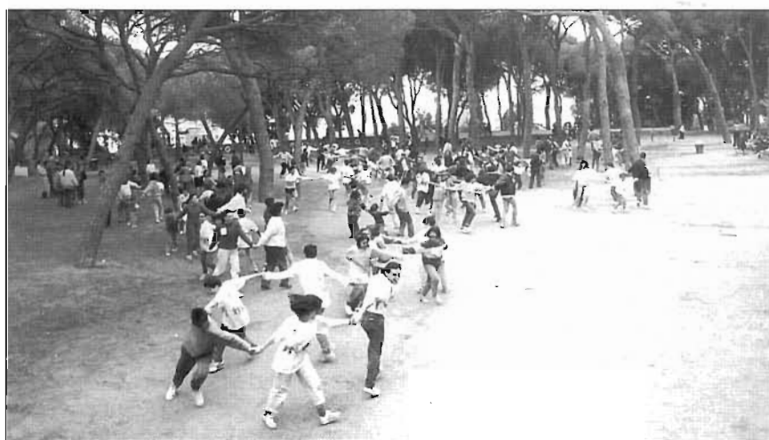
Dues fotos. Trobada amb motiu dels 25 anys de l'esplai, a Calella