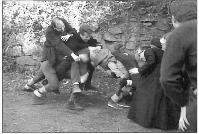
i tampoc no hi faltava la gresca...