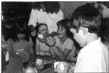
Colònies al Bagís, estiu de 1984