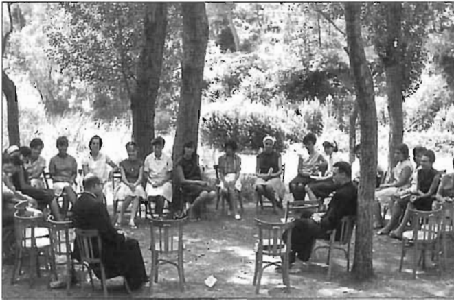
Les reunions no podien faltar ni enmig del bosc.....