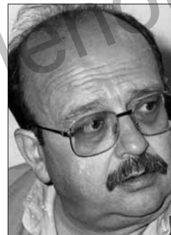
Manuel Vázquez Montalbán

Feia poc que havia anat a viure al barri, des que havia aconseguit una de les novíssimes cases amb jardí a Diagonal Mar. L'encantava l'aire salobre i la proximitat de la platja, i allò de poder viure a plena ciutat com si fos un poblet d'estiueig però amb totes les comodi-