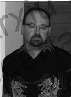
Carlos Ruiz Zafón