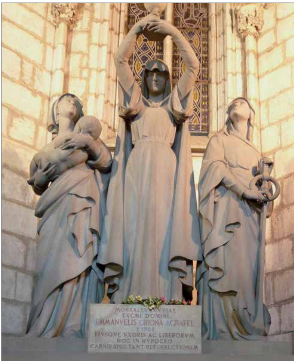
Sepulcre de Manuel Girona, amb grup escultòric de Manuel Fuxà, al claustre de la catedral de Barcelona.

i financers de Madrid i de Bilbao. Fundà Sociedad Altos Hornos y Fábricas de Hierro y Acero de Bilbao, que més endavant va ser Altos Hornos de Vizcaya, el principal grup siderometal·lúrgic d'Espanya. Així mateix, va fundar una altra empresa mítica, Compañía General de Tabacos de Filipinas.