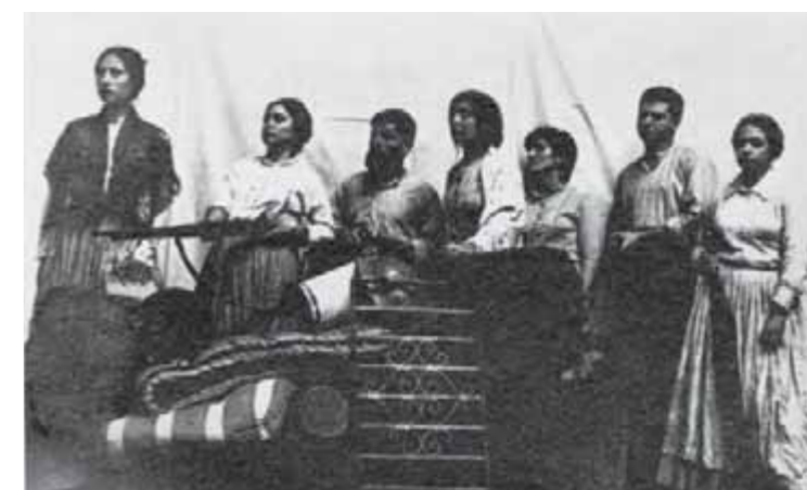
Diversos moments de la representació al Casino de l'obra de teatre dirigida per Lluís Pasqual, amb un gran èxit de públic.

Quan ens vàrem plantejar per primera vegada el treball a fer sobre la Setmana Tràgica, és a dir, la narració d'un esdeveniment històric, se'ns va presentar una qüestió fonamental, en desllorigador, en definitiva, de qualsevol narració dramàtica: el punt de vista amb el qual havíem de prendre els fets, que determinaria l'òptica amb què l'havíem d'explicar. No podíem recórrer a la inexistent —almenys en teatre— imparcialitat històrica. I tampoc no és feina del teatre —ens sembla— fer la labor d'un llibre d'investigació. La clau ens la donava el mateix nom, absolutament dramàtic, Setmana Tràgica , i l'ambivalència que aquest adjectiu, tràgica, tenia. La setmana del 26 de juliol al primer d'agost de 1909, en la nostra opinió, no va ser tràgica per allò que hi va passar. No ens servia el matís que hi havien donat els elements que van caracteritzar la repressió de després. La nostra setmana va ser tràgica precisament per allò que podia haver esdevingut i no va arribar a ser per manca de direcció. Mirant els llibres d'història, els diaris de l'època, el text, les fotografies, ens trobàvem amb una gent al carrer durant uns dies i, al final, la mateixa gent decebuda, ensorrada i, més tard encara, empresonada, desterrada o condemnada a mort. No vàrem dubtar gens: havia de ser aquesta gent, la gent «que ens vàrem llançar al carrer perquè havíem de fer alguna cosa», la qui havia d'explicar la Setmana Tràgica.