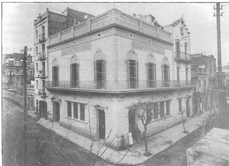
La cooperativa tenia sucursals al barri. La imatge pertany a la número sis, situada al carrer Marià Cubí

resultat de les diferents influències que rep, tant teòriques com d'origen social. El desenvolupament científic i tècnic que s'assoleix al llarg del segle XIX obliga a canviar els vells motlles que regien la societat, per la qual cosa la problemàtica social adquireix un nou enfocament i una nova concepció: en aquest moment la vida no s'explica a través de l'especulació metafísica sinó partint de fenòmens materials. El positivisme d'August Comte (1798-1857), l'evolucionisme de J. B. Lamarck (1744-1829), ampliat per Charles R. Darwin (1809-1882), l'idealisme objectiu i l'esquerra hegeliana (Hegel, 1770-1831) i el materialisme històric de Karl Marx (1818-1883), representen les bases ideològiques del socialisme utòpic desenvolupat, entre altres, per Saint-Simon, Fourier i Owen, i del socialisme científic, defensat per Marx i Engels, que fonamentaren els orígens del moviment obrer.