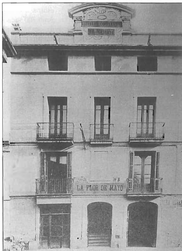
Sucursal número tres de la cooperativa, situada al carrer Galileu, 40.

A l'abril del 1935 en el canvi de Junta, cessa el president en Jaume Anglès, vell lluitador cooperativista molt significat i el 14 de juny del mateix any, es pren el sorprenent