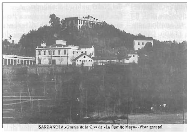
SARDAÑOLA.-Granja de la C. va de «La Flor de Mayo».-Vista general

El 1920 la Cambra Regional de Cooperatives Catalano-Balears es transforma en la Federació de Cooperatives de Catalunya i al mateix temps s'organitzen dos congressos importants: el Quart Congrés de Cooperatives Catalanes, a Barcelona, i el de València. A les Illes s'estén el moviment cooperativista, a Maó, a Ciutadella i a Artà, especialment, mentre que al Rosselló s'intenta d'aplicar-lo al comerç dels vins.