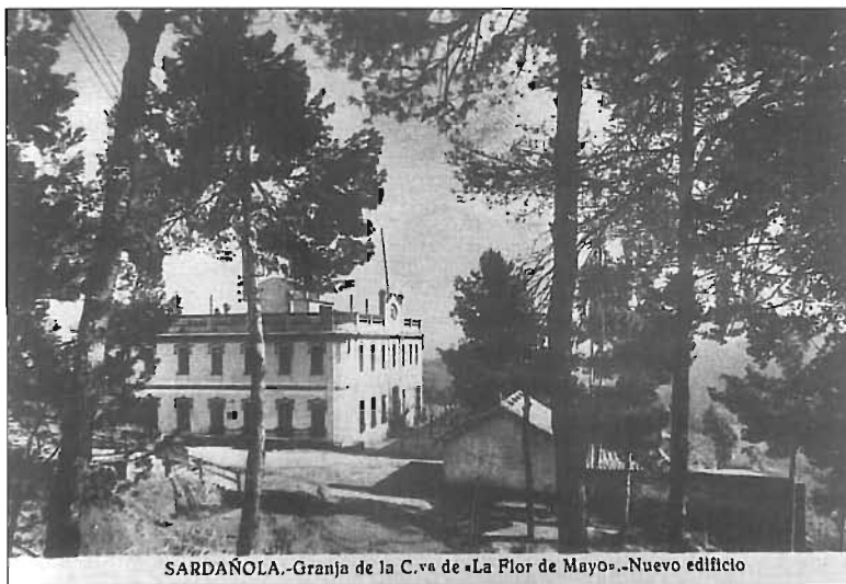
Aspecte de la granja de Cerdanyola.

Quan s'intenta recollir una breu història d'aquesta entitat, cal recordar amb admiració la gesta d'aquells homes fundadors, guiats amb entusiasmes ideals cooperatius, que iniciaren al Poblenou allò que esdevindria una institució cooperativista molt ambiciosa, observada com a model per altres cooperatives que anaven creixent en aquell temps per tot Catalunya.