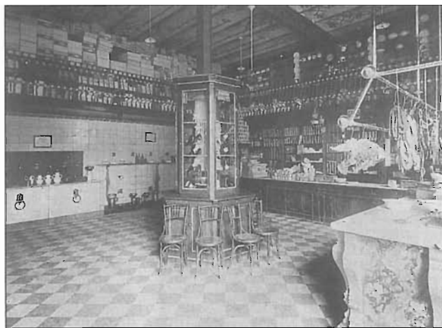
Secció de comestible de la seu central, 1925.

ca posterior. El seu èxit econòmic crea escola, tant a la Gran Bretanya com a altres països europeus. Les cooperatives de consum s'estenen ràpidament a tota Europa. Les cooperatives agrícoles i de pescadors es consoliden sobretot a estats asiàtics amb tradicions de pràctiques d'ajuda mútua molt antigues.