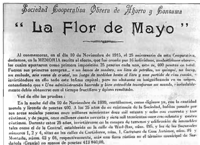
Cartell commemoratiu del 25 aniversari de la cooperativa, 1915.

Els renascuts sindicats obrers creen l'octubre de 1868 una Direcció Central de les Societats Obreres de Barcelona, que celebra un congrés a Barcelona al mes de desembre en el qual es decideix donar suport a la forma de govern republicà federal, amb la participació dels obrers en la vida política i la fórmula cooperativa. La col·laboració de la classe obrera organitzada sindicalment amb l'esquerra política es trenca els anys posteriors a conseqüència del radicalisme de la Primera Internacional i de la debilitat del Partit Federal, que no va poder impedir el retorn de la monarquia, amb l'arribada d'Amadeu I de Savoia, el 30 de desembre de 1869, fins a l'any 1873.