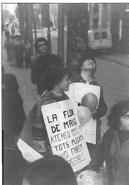
L'Associació de Veïns del Poblenou va endegar diversos actes reivindicatius en favor de la recuperació dels locals de la Flor de Maig per activitats socials i culturals del Poblenou, 1977.

acord de Junta d'anunciar a la Vanguardia la venda de la Granja de Cerdanyola, per veure de suavitzar la situació econòmica [...].»