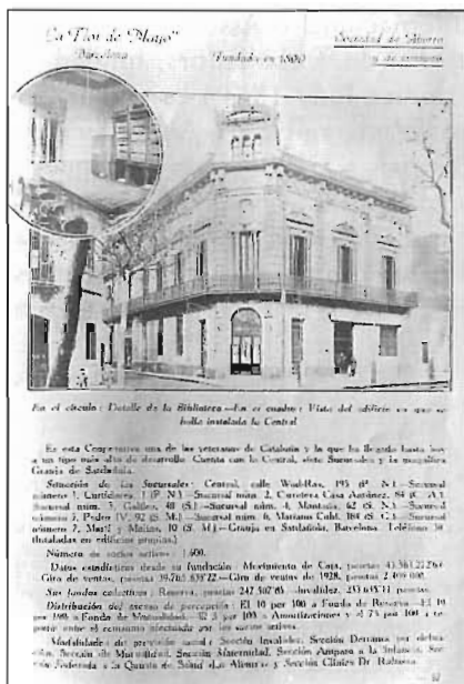
Imatge de la seu central de l'entitat al carrer Bac de Roda, 1928.

Progressivament la Internacional va essent coneguda a Barcelona i a la resta del país, i nuclis hispànics s'afilien tant a la Internacional com a l'Aliança Internacional de la Democràcia Socialista.