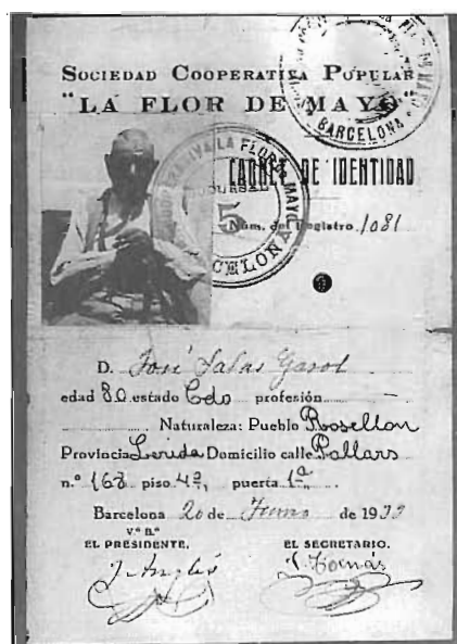
Carnet d'un associat a l'entitat.

La nit del 10 de novembre de 1890 es crea la Flor de Maig, una fundació