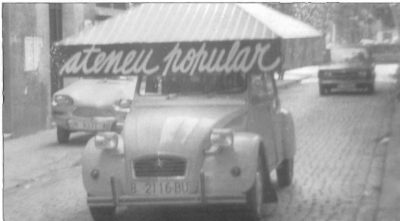
Aspecte de les manifestacions per la conversió de l'antiga cooperativa en Ateneu Popular.