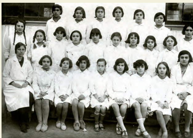
Un grup de nenes de l'Escola dels Protestants a finals dels anys vint.

I el paradís se'm va escapar de les mans. Malgrat la falta de formació pedagògica, Les Senyoretetes havien tingut prou sentit comú i respecte pels nens per fer-nos sentir especials i no malbaratar una cosa essencial: la nostra autoestima. No en deu viure cap, d'aquelles dones, però si me les trobés els donaria les gràcies. ●