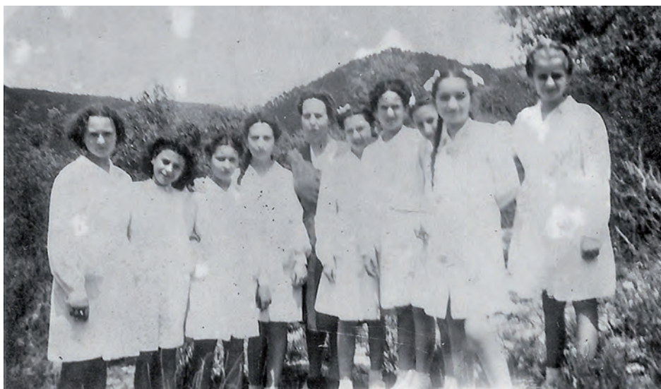
Alumnes del Col·legi Mirabet a la dècada dels anys quaranta.

perfecta, a l'anglesa, també la «redondilla» i la gòtica.