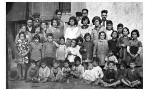
El berenador de la Mina a començament del segle xx.

No, no encara. Aquí a la plaça encara s'hi posen.