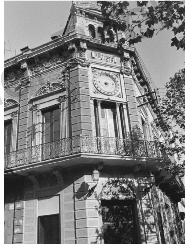
Façana de La Flor de Maig al carrer de Wad-Ras. Octubre del 1978.

del segle XIX i principis del XX. L'any 1975, gairebé acabat el règim franquista, l'Associació de Veïns del Poblenou va reivindicar davant de l'Ajuntament la recuperació dels locals del carrer de Wad-ras, amb l'objectiu de destinar-los al desenvolupament d'activitats socioculturals. Per aquesta