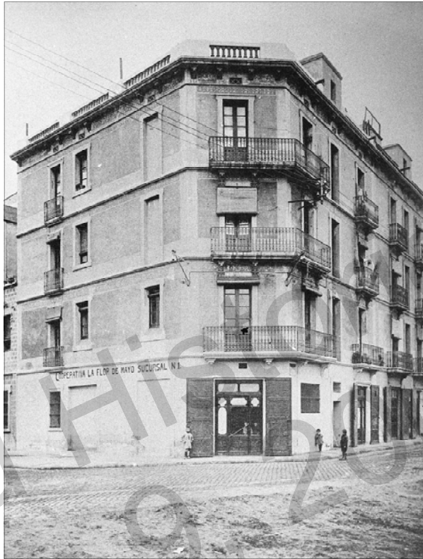
Primer curs d'oberta per la Cooperativa La Flor de Maig, al carrer Pellaires. Anys vint.

Les característiques que defineixen un ateneu s'estableixen en un manifest públic en el qual queden implicades diverses entitats d'aquesta tipologia. 1 Seguint els seus criteris, un dels principis que guien l'esperit de l'ateneu és el fet de tenir un caràcter unitari, democràtic, pluralista i independent enfront de l'Administració, els partits polítics o qualsevol altra institució; una segona premissa que cal tenir en compte és que tracta d'enfocar les seves finalitats a potenciar un centre de convivència i comunicació dels veïns del barri (que poden realitzar activitats i emprar els serveis de difusió cultural) per tal de gaudir d'una formació permanent; en tercer lloc, l'ateneu promou la participació dels veïns en tasques i activitats que afavoreixin la creativitat dels participants i, a més a més, ha de treballar de manera activa en aquelles iniciatives que puguin contribuir a desenvolupar la vida comunitària i cultural del barri. Finalment, la voluntat de tot ateneu, segons aquest manifest, és ser una entitat oberta a tots els sectors del barri i gaudir d'una vida, uns ingressos i uns òrgans decisoris propis i