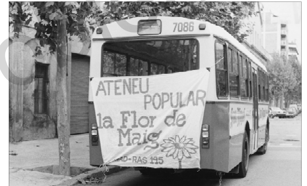
Excursió amb autobús de l'Ateneu popular La Flor de Maig. Any 1980.

Cap a l'any 1923, la cooperativa va posar en marxa una sèrie d'escoles nocturnes per a adults que, tal com es desprèn de la memòria de la cooperativa, no van tenir l'èxit esperat. No obstant això, l'any 1928 es reprèn la iniciativa i es posa en marxa un fons col·lectiu amb l'objectiu de tornar a fer classes nocturnes, que es van tornar a suspendre més endavant sense saber-ne les causes exactes.