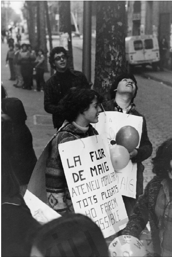
Reivindicació de La Flor de Maig com a ateneu popular. Rambla del Poblenou. Any 1977.

a aquest temps, a més de les diverses activitats realitzades pels grups integrants del centre, s'han portat a terme activitats addicionals promogudes per l'Ateneu per si mateix. Però la vida de l'Ateneu no ha estat sempre fèrtil i afortunada. L'any 1999, després de patir la davallada de socis i entitats produïda amb la inauguració del Centre Cívic Can Felipa, l'Ajuntament va arribar a pensar a dausurar l'indret que havia caigut en l'oblit i havia estat