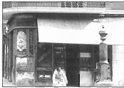
Model de la font, motiu de la notícia dels dies 8 i 9 de juny que estava al carrer Pujades xamfrà Marià Aguiló. Aquesta font manté el pinacle original, que hi manca al carrer Doctor Trueta

una de nova. L'Ajuntament torna a col·locar la font al seu lloc, que ja estava desmuntada i a punt d'anar al magatzem de les andròmines. Aquesta font té una curiosa història: pertany a l'època del Sant Martí independent i, al principi, estava instal·lada al bell mig de la cruïlla dels dos carrers. Quan van posar en circulació la línia de tramvies de via estreta número 41, van haver de fer un mig cercle amb les vies perquè la font continués al centre. Després es va traslladar a un cantó per evitar perills. La font, en part mutilada, és l'única que resta al barri d'aquest tipus.