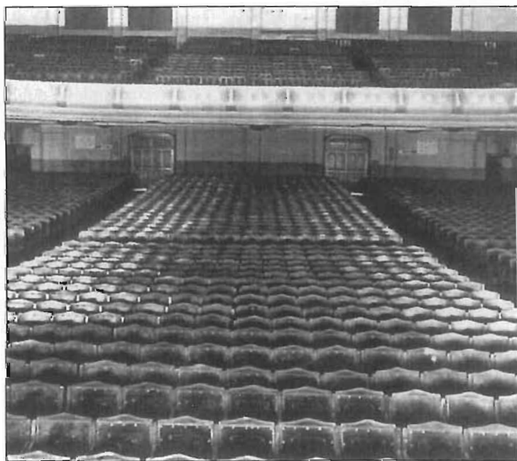
Interior de l'antic cinema Ideal.