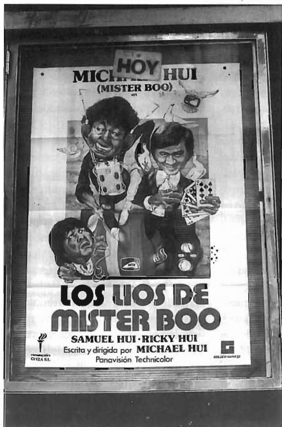
Cartell del darrer programa de cinema de la sala Triunfo.

Encara hi havia una altra sala, la del Centre Moral, però aquesta s'assemblava més als cines «de veritat», ja que les projeccions eren en màquines professionals de 35 mm, el programa doble i, encara que el preu fos reduït, s'havia de pagar l'entrada. Les projeccions eren quinzenals, ja que s'alternaven amb les representacions de teatre de la casa. 17