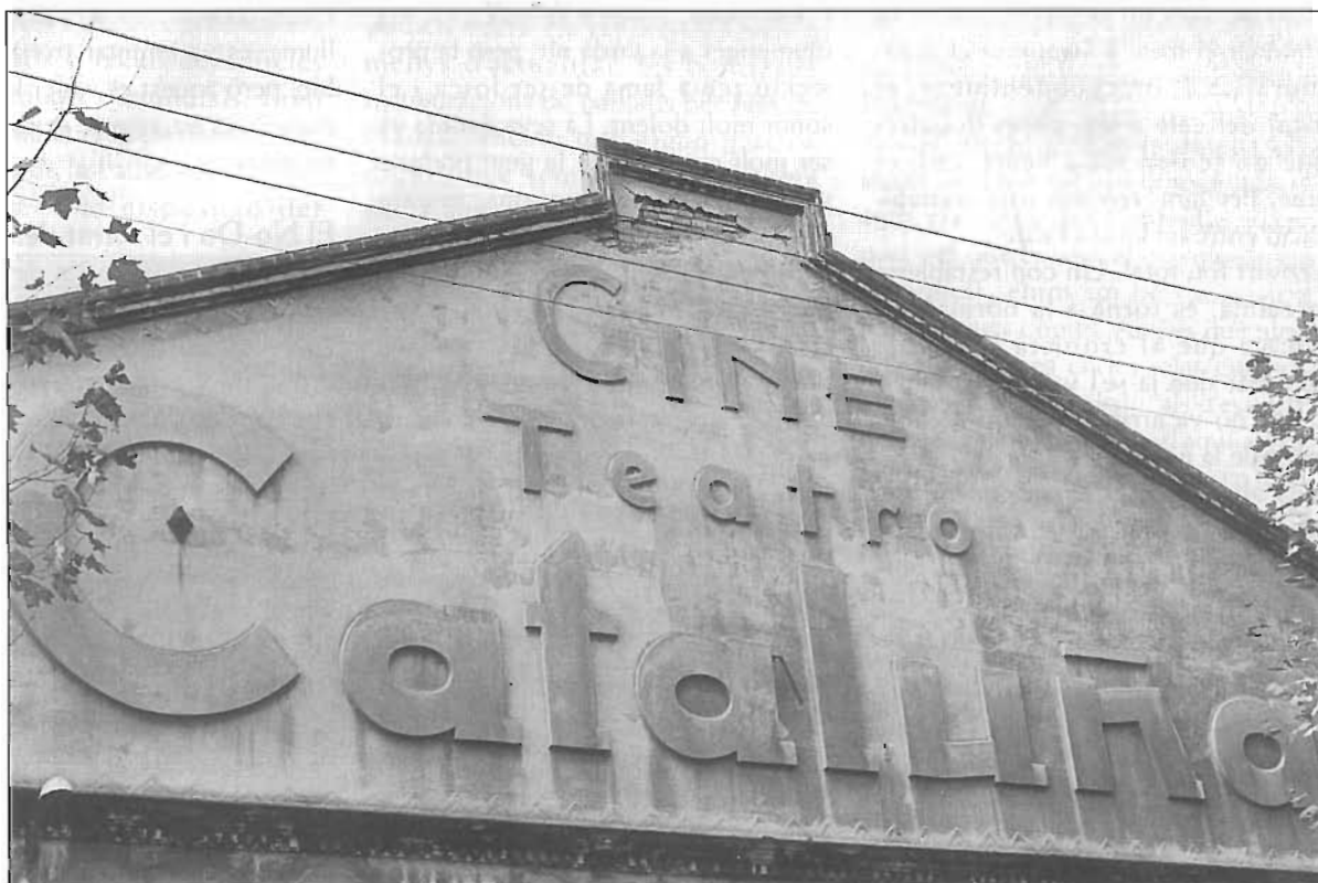
Façana del "Cine Teatro Catalaño".

Dues anècdotes més a propòsit d'aquesta sala. El dia de Nadal de l'any 1943 es projectava la pel·lícula espanyola de Benito Perojo Goyescas , inspirada en quadres i en la vida de Goya, amb música de Falla i interpretada per l'aleshores popularíssima actriu i cantant Imperio Argentina, que feia el doble paper de la duquesa d'Alba i el d'una gitana 5 S'hi sumaven dos actors: el consagrat Rafael Rivelles i el quasi debutant i després