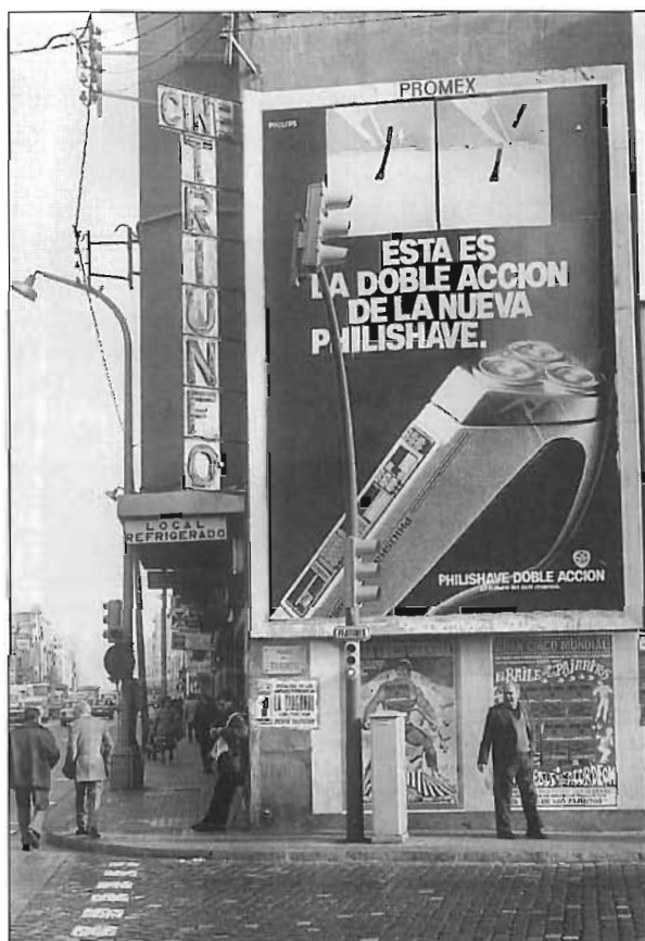
Cantonada del cinema Triunfo, situat a la confluència de la Rambla del Poblenou i Pere IV.

l'Urgel ni el Palacio Balañá i que el Coliseum era considerat teatre. 15 Pertanyia a la mateixa empresa que L'Aliança i, en principi, només programava els dijous, els dissabtes i els diumenges.