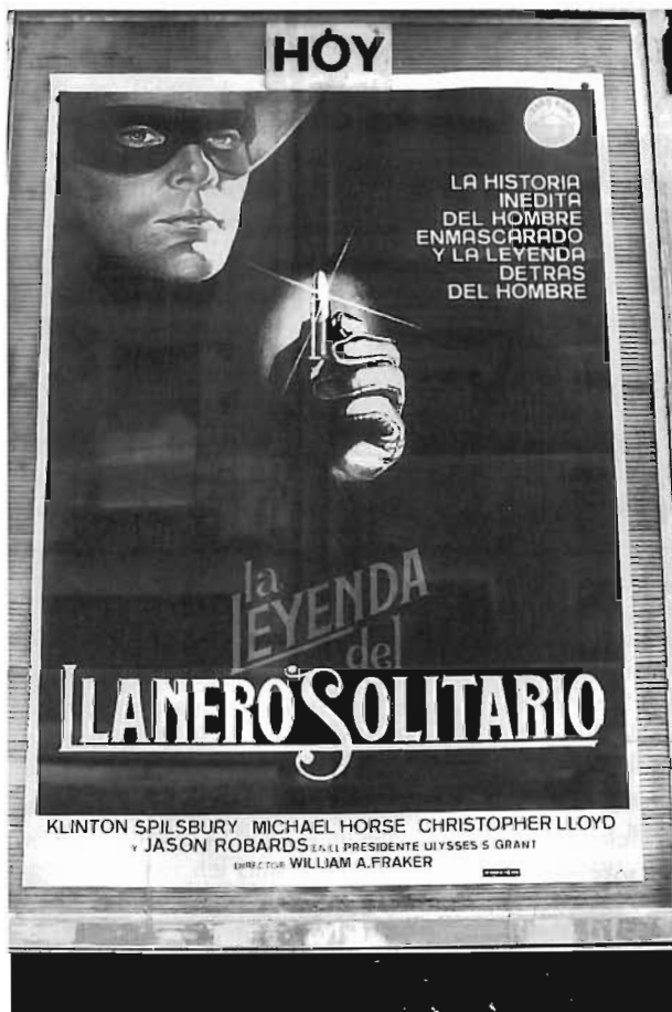
Als darrers anys de la seva existència, el Triunfo s'especialitzà en pel·lícules de sèrie B.

exterior, i es van fer unes sortides d'emergència o de fi de sessió a la Rambla, que també eren aprofitades a l'estiu per airejar el local. Es van instal·lar unes autèntiques butaques i, per decorar la pantalla, cal recordar que era abans de tots els scopes i d'altres sistemes de projecció de format ample, es va emmarcar el quadrat amb unes enormes roses de guix que, tot són gustos!, uns trobaven que eren maquiíssimes i, uns altres, una autèntica horterada . Però els primers no van tenir temps de gaudir-ne gaire ja que la introducció de les