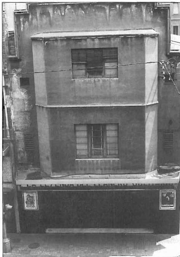
Façana de l'antic cinema Triunfo.

Aquest local i el Monumental del carrer de Sant Pau de Barcelona, davant de la caserna de la Guàrdia Civil, avui també desaparegut, eren els més grans de la ciutat. S'ha de tenir en compte que no existien ni