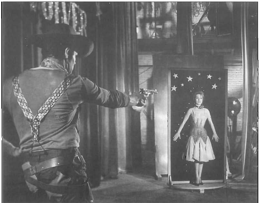
La pel·lícula Altas variedades va ser rodada al Casino l'Aliança, que durant uns anys fou sala de projecció.

El cine Aliança estava situat al xamfrà de la Rambla amb Doctor Trueta (dit en aquell temps Wad-