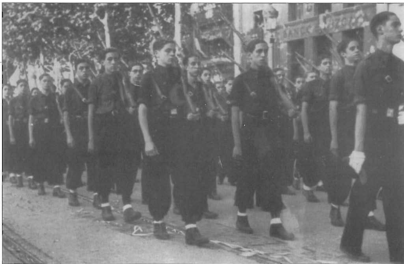
L'anomenada "època blava" es deixà sentir de manera especial al cinema, amb el bombardeig constant de propaganda del règim.

L'espaiosa façana de L'Aliança permetia que quedessin ben anunciades les pel·lícules que s'hi projectaven, ja que a part de diverses vitrines on