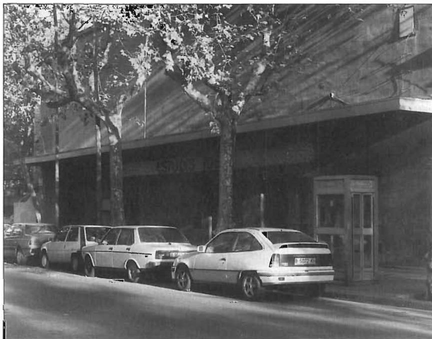
El cinema Ideal va ser convertit en estudi de grabació audiovisual en deixar de ser exhibidora.

Com que era l'any 1947 i els aliats havien guanyat la guerra mundial dos anys abans, ja no eren tan dolents, sobretot els americans, i es va permetre que es digués California, nom que, amb tota seguretat, uns anys abans no s'hagués tolerat. I en aquest punt no hem d'oblidar que, un