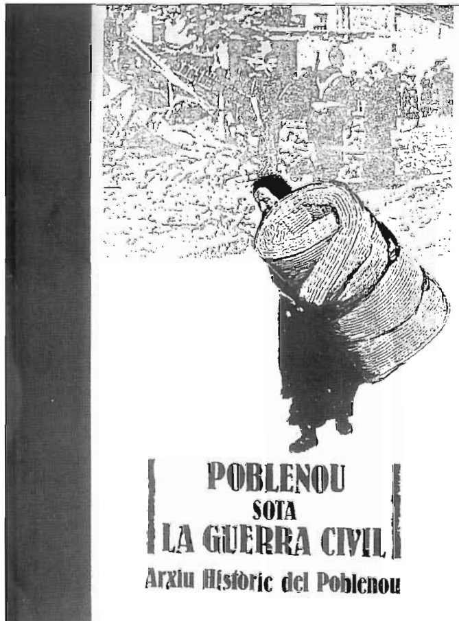
Videos editats per A.H.P.

POBLENOU SOTA LA GUERRA CIVIL Arxiu Històric del Poble Nou