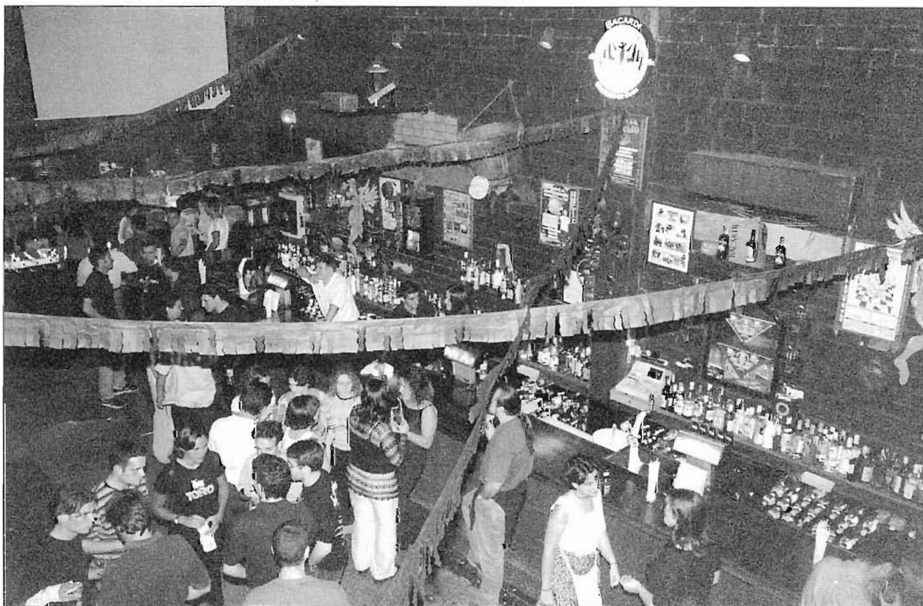
Interior Bóveda