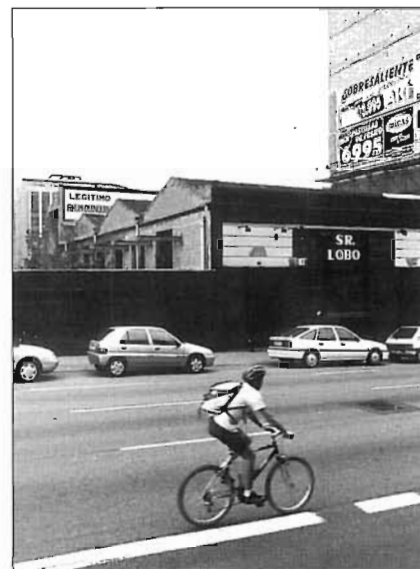
Tranquil aspecte, als matins, del Sr. Lobo, un local del carrer dels Almogàvers, que ha canviat sovint de nom.

Cal destacar també Bóveda (Pallars, 97), que, amb un públic semblant al que podem trobar al Mare-