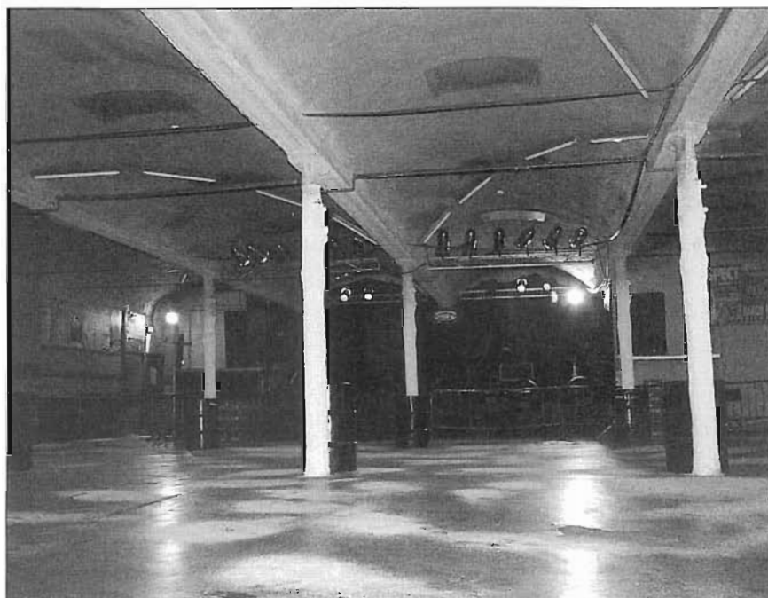
El Garatge Club