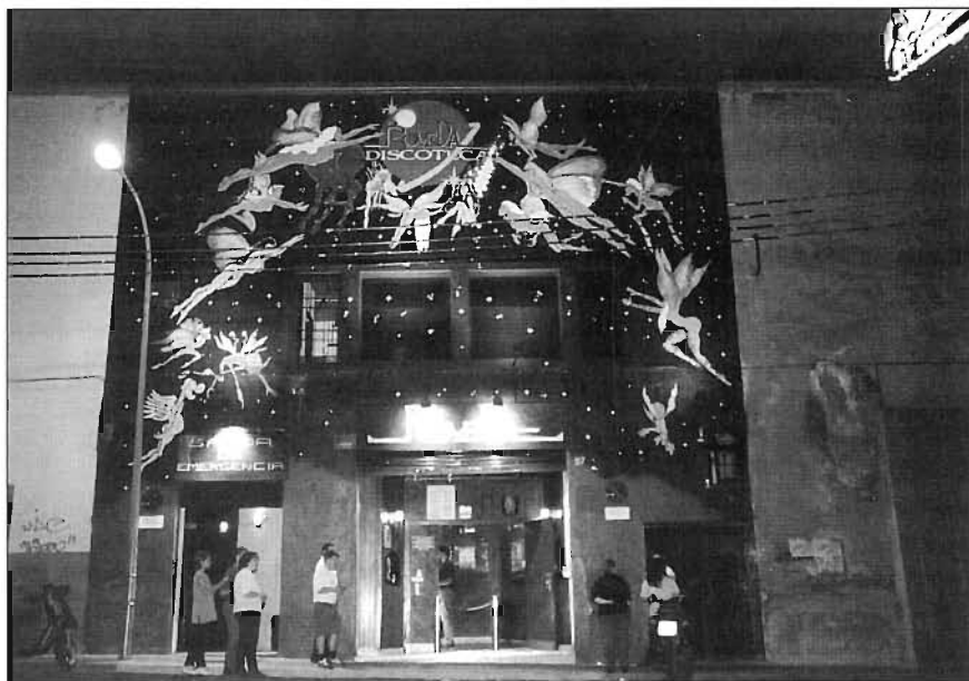
L'entrada de Bóveda, un dels locals més coneguts, al carrer de Pallars

La taverna per antonomàsia seria L'Ovella (Zamora, 78), germana petita (per edat i no pas per grandària) de la del carrer de les Sitges, tota una tradició que, amagada sota un pont, ocupa una enorme nau de dues plantes. També hi destaca l'acabada d'inaugurar Sonora Taverna-Pop (Pamplona, 96), amb una decoració entre tex-mex i colonial, que es podria agermanar amb el Saloon El Paso (Pujadas, 64), on es pot sopar o prendre una cervesa com si fossis