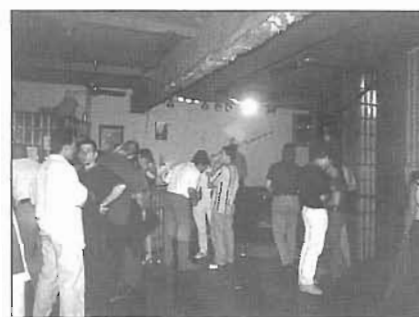
El bar Ceferino de nit i per dins