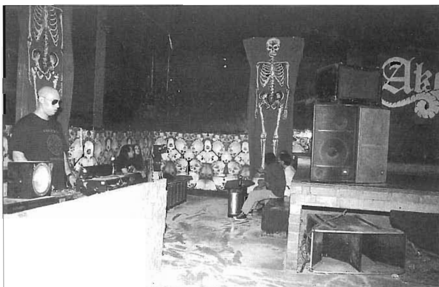
Puerto Hurraco, que va heretar un antic bar de barri a la zona més degradada del Taulat