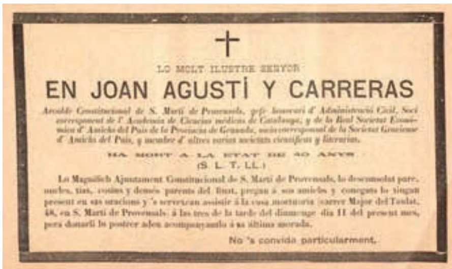
Esquela publicada a L'Arch de Sant Martí .