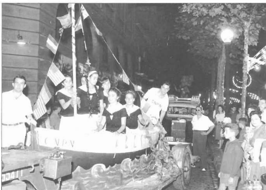
La carrossa del CNPN a la desfilada per la Rambla que va obrir la Festa Major de l'any 1961.

Però el somni no havia acabat. Al cap d'uns quinze anys, sorgiren grans errors de construcció. Aquest darrer punt, juntament amb mal moment econòmic que travessava el club, preveïen un estat de decadència sense sortida. Econòmicament el club estava estancat, però no pas la seva activitat esportiva. Any rere any, els seus nedadors i waterpolistes en