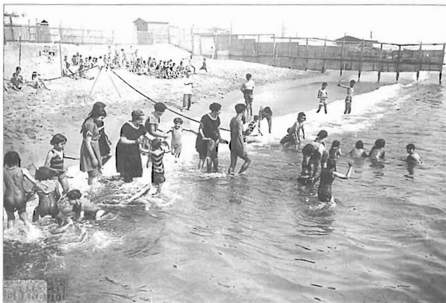
L'any 1945 trobem aquestes casetes de bany dins del recinte del CNPN, a la platja de la Mar Bella.

Les constants tragèdies provocades per les inclemències del mar van fer adonar als responsables del club que la piscina no es podia construir a la platja i que s'havia de buscar una nova ubicació. Es creà una comissió pro piscina i, finalment, el 1961 es va inaugurar l'edifici de l'antiga plaça de Lope de Vega, avui Jardins de Josep Trueta, que es va convertir en la seu del CNPN. Es tractava de la primera piscina coberta municipal de tot Barcelona. L'Ajuntament va cedir la gestió i el manteniment de les instal·lacions al club durant cinc anys renovables. A partir d'aquell moment es podia practicar la natació durant tot l'any.