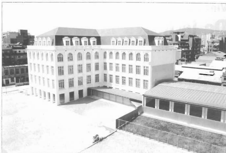
L'any 1990, l'edifici de Can Felipa es trobava en procés de rehabilitació per convertir-lo en centre cívic i poliesportiu.

Actualment, el CNPN travessa un moment força delicat, originat per grans dificultats econòmiques. El seu futur, ara per ara, és molt confús. Les causes són múltiples: anys de mala gestió, enfrontaments personals, personalismes, etc. Aquesta situació es va fer patent ara fa dos anys. A partir d'aquell moment la junta directiva va engegar una política de reconstrucció. En un principi es va optar per crear una societat limitada anomenada Esportiu Poblenou Mar Bella. Formada en el 60 % per l'empresa UBAE i en el 40 % pel CNPN, havia de completar la inversió que faltava, segons el contracte de concessió, del poliesportiu de la Mar Bella: uns 200 milions de pessetes. UBAE aportava els avals que el club no tenia per tirar endavant les obres. Es construiria la piscina i s'adequaria tota la instal·lació que ara per ara està força deteriorada. Però la realitat ha estat una altra: d'una banda, el club ha perdut la concessió de Can Felipa guanyada per la societat limitada Esportiu Poblenou Mar Bella i, de l'altra, només li queda guanyar el concurs de concessió de la Mar Bella, i això últim està molt negre. La manca de capital per mantenir les instal·lacions i el descrèdit en el qual ha caigut el club han originat la pèrdua d'una de les úniques forces de què es disposava: el suport moral i financer dels socis. El futur del club es troba a la corda fluixa, la seva identitat depèn únicament de guanyar el concurs de la Mar Bella; si no, podríem parlar de la total desaparició