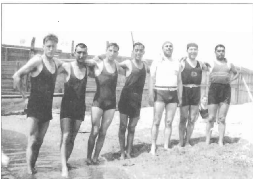
Un grup de joves nedadors a les instal·lacions del CNPN, situades a la platja de la Mar Bella l'any 1920.

Paral·lelament, pensaren instal·lar-se als antics banys de la Mar Bella, però l'Ajuntament, després d'omplir de falses il·lusions, denegà l'autorització perquè tenia previst edificar centres educatius en aquell solar. Així, de moment, només van construir un immoble de fusta sobre pilars de formigó armat, però tot el que alçaven amb voluntat i il·lusió el mar s'ho emportava. Els informes anuals d'aquella època demostren que pràcticament tots els ingressos de l'associació es perdien a reparar aquelles catàstro-