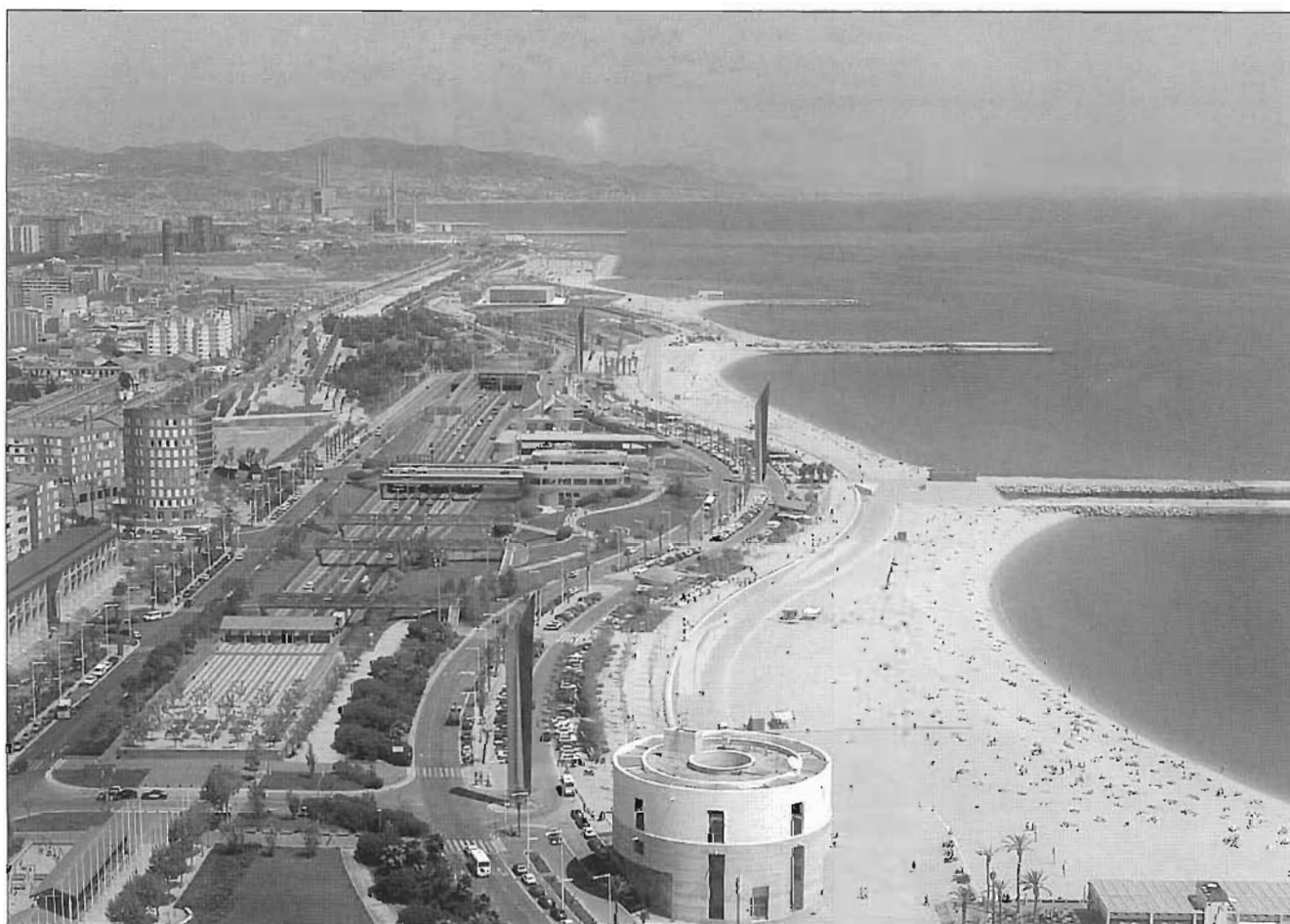
Les platges del Poble Nou des de l'aire. L'edifici del davant és el bonic Centre Meteorològic construït per l'arquitecte portuguès Alvaro Siza.