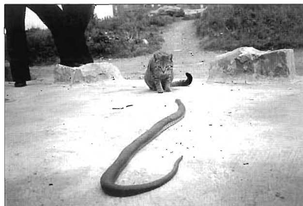
El 1974 els veïns de la zona dels tres Pallars trobaven una serp enmig de la runa que envoltava el sector.