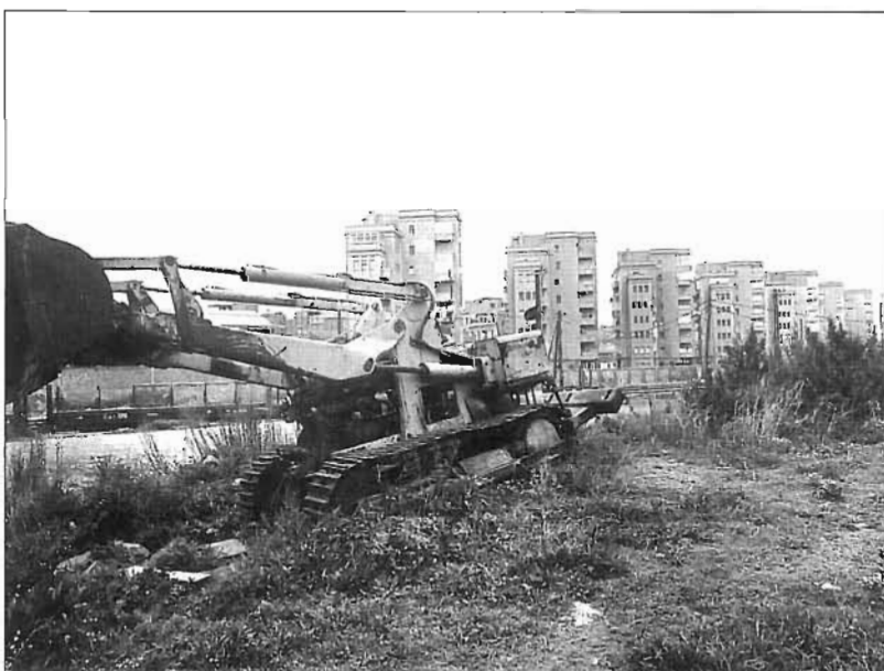
El passeig de Calvell a començaments dels anys vuitanta