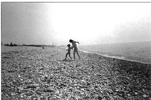
Dues noies intenten no punxar-se enmig de les pedres i restes de tota mena que amagava bona part de la sorra de la Mar Bella.