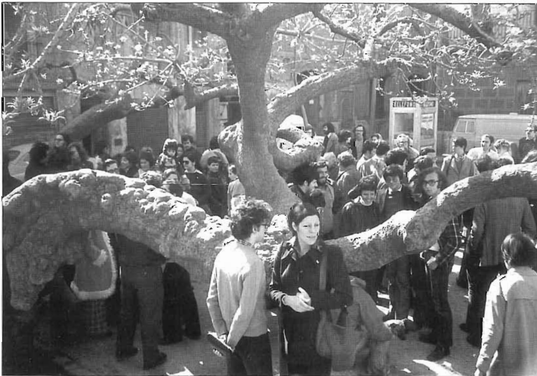
Visita crítica organitzada per l'associació de veïns, a la tardor de 1974. A la foto, un dels bellaombres de la plaça de Prim