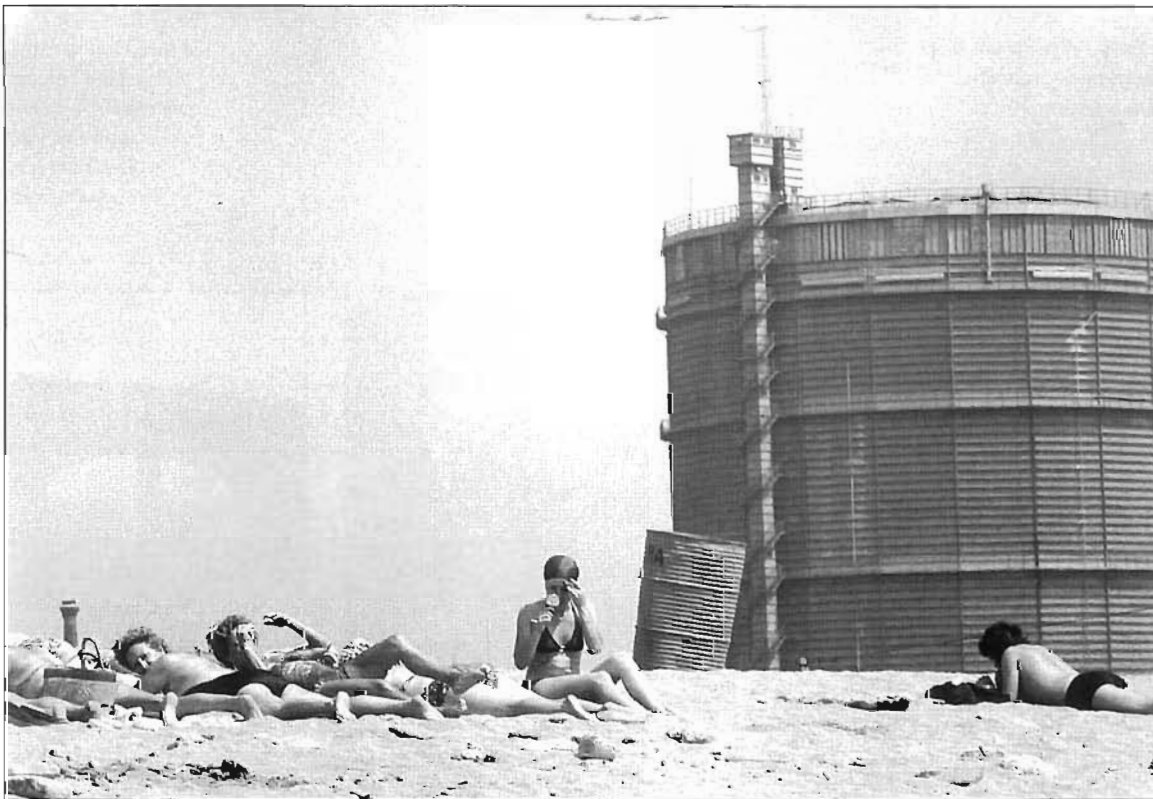
La Mar Bella, amb neu al gener de 1983, i amb l'inevitable gasòmetre com a decorat de fons, a l'estiu de 1979