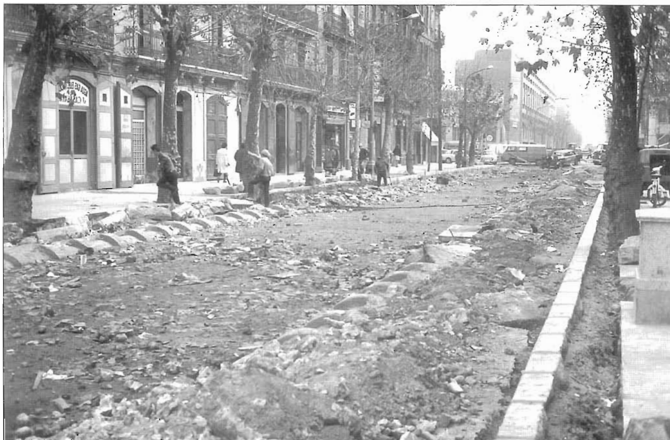
Obres del metro al carrer de Pujades. Per manca de diners van estar uns mesos empantanades, a principis de 1976.

La indústria Fertrat contaminava amb cianur. L'AV Poble Nou va impulsar un partit de futbol reivindicatiu amb dos equips de joves del barri i el grup Roba Estesa va representar l'esgarrifosa llegenda dels fums. Els dos equips van empatar a un gol. Era el juliol de 1975.