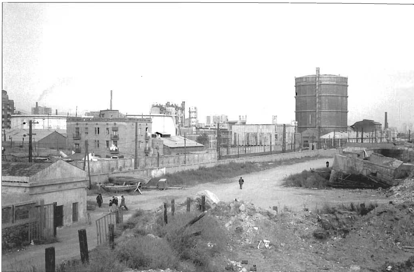
L'entrada a la Mar Bella i el pas a nivell del carrer de La Jonquera, el vell gasòmetre. Paisatge de finals dels anys setanta