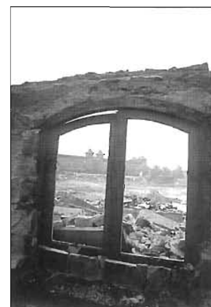
La vella Protecció de Menors del carrer de Ramon Turró era un edifici guardonat obra d'Enric Sagnier. A mitjan anys setanta ofería un aspecte desolador.