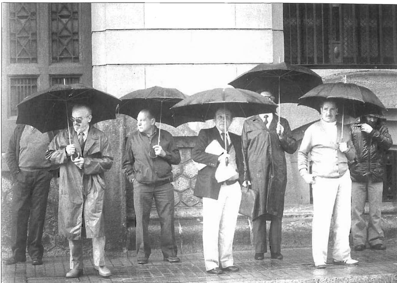
Esperant l'autobús sota la pluja a la vella avinguda d'Icària