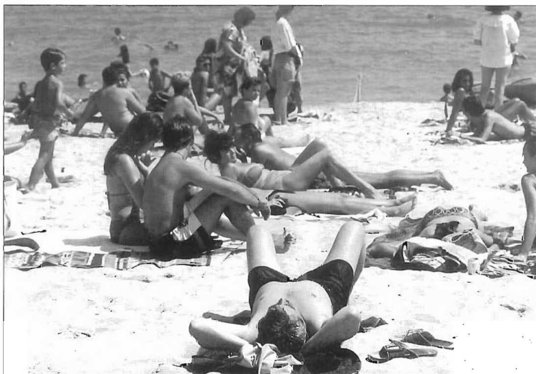
Juny de 1994. La Mar Bella ha estat recuperada amb l'esforç olímpic. En primer terme, un banyista especial, l'aleshores alcalde Pasqual Maragall.