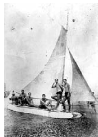
La platja era un lloc d'esbarjo per als poblenovins de començaments del segle xx.