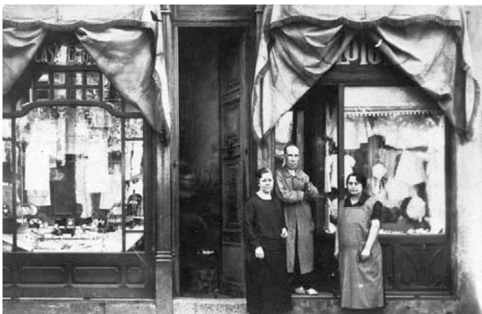
► La botiga de Can Masjuan a començaments del segle xx.