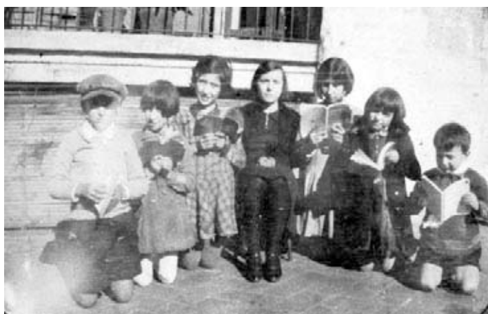
Els terrats del carrer de Marià Aguiló, un lloc d'esbarjo.