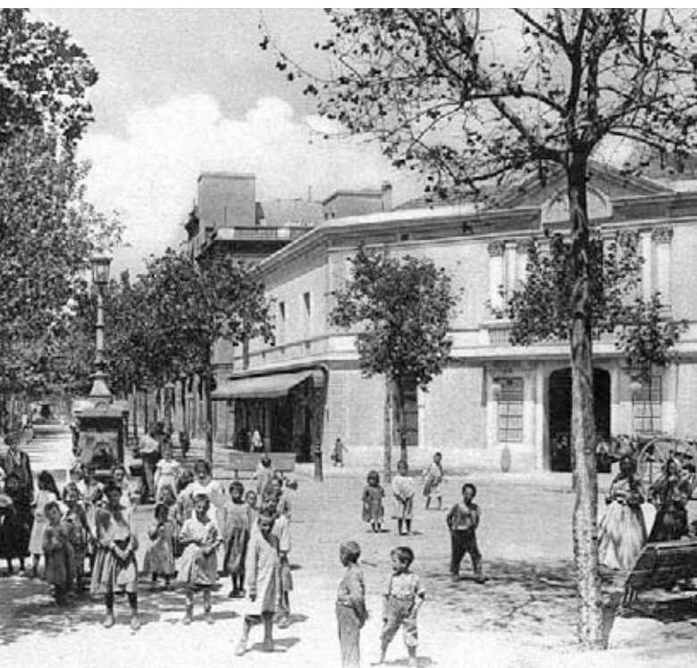
▶ Ballada de sardanes davant del Centre Moral al carrer de Pallars, a la dècada dels anys deu del segle xx.