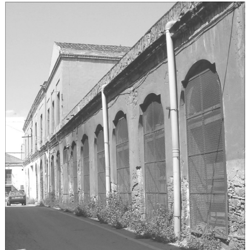
La fàbrica es construeix al llarg del tercer quart del segle XIX seguint les línies del projecte d'empremta neoclàssica de Bernadet de