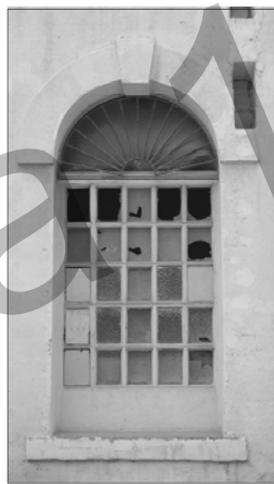
Detalls de les diferents obertures de les naus de can Ricart. La fidelitat al disseny de Josep Oriol Bernadet a tot el recinte històric és absoluta.

naus diàfanes, combinant encavallades i estructures verticals de pilars. Després d'haver analitzat tot el conjunt es confirma que hi ha tot un seguit de constants en la composició i el llenguatge formal que donen aquesta unitat tan característica a Can Ricart.