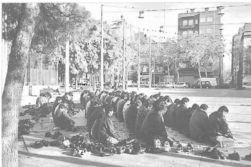
Per primera vegada, la comunitat musulmana celebra el mes del Ramadà a la plaça Doctor Trueta.

17/04 Acte de col·locació de la primera pedra de l'edifici T-Systems al districte d'activitats 22@. L'empresa T-Systems ocuparà un edifici de 18.000 m 2 al carrer Sancho de Àvila, entre Badajoz i Ciutat de Granada.