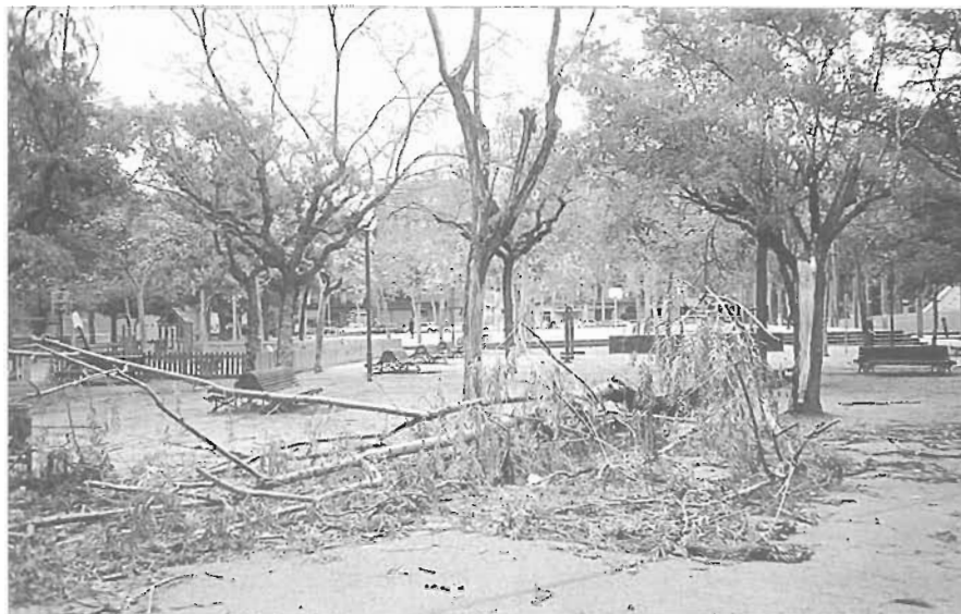
Efectes de la tempesta que sacsejà el barri a mitjan novembre de 2001.