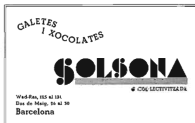
Anunci de la fàbrica Solsona, quan va ser col·lectivitzada durant la Guerra Civil