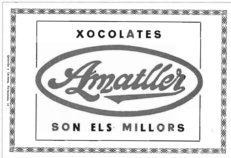
Dos anuncis de Xocolates Amatlle

lunya, té un sol exponent martinenc d'interès, i es trobava al Poblenou.