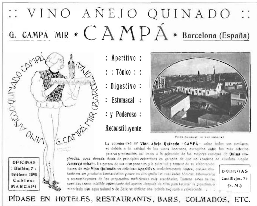
El vi de quina de Campà s'anunciava també com a reconstituent, 1913

vui, Doctor Trueta i Àvila, respectivament), que era reflectit en un dibuix inserit en totes les caixes de galetes i els altres productes com a distintiu de la marca. L'edifici va ser reformat. De la primitiva Solsona, no en queden sinó unes naus de l'edifici primer que donaven al carrer de Wad-ras.