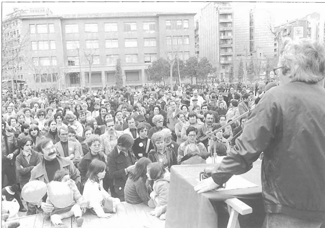
Miting electoral dels socialistes l'any 1979 a la plaça Doctor Trueta. (AHPN)