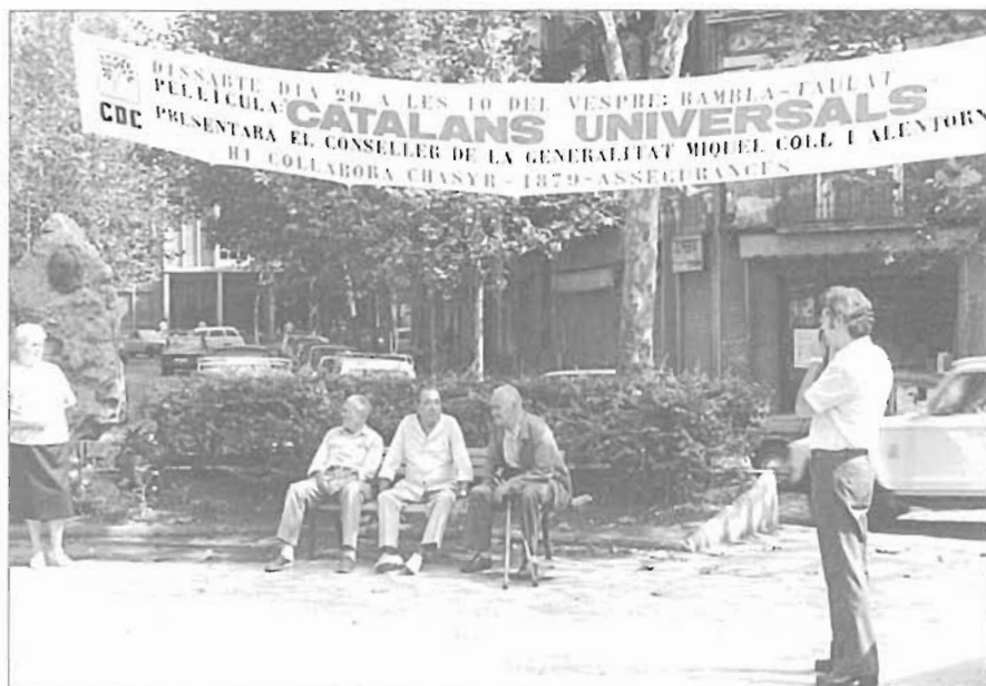
A la rodona de la Rambla / Doctor Trueta, CiU desplega aquesta pancarta. La seva seu es trobava al costat, al número 24 del carrer Doctor Trueta.