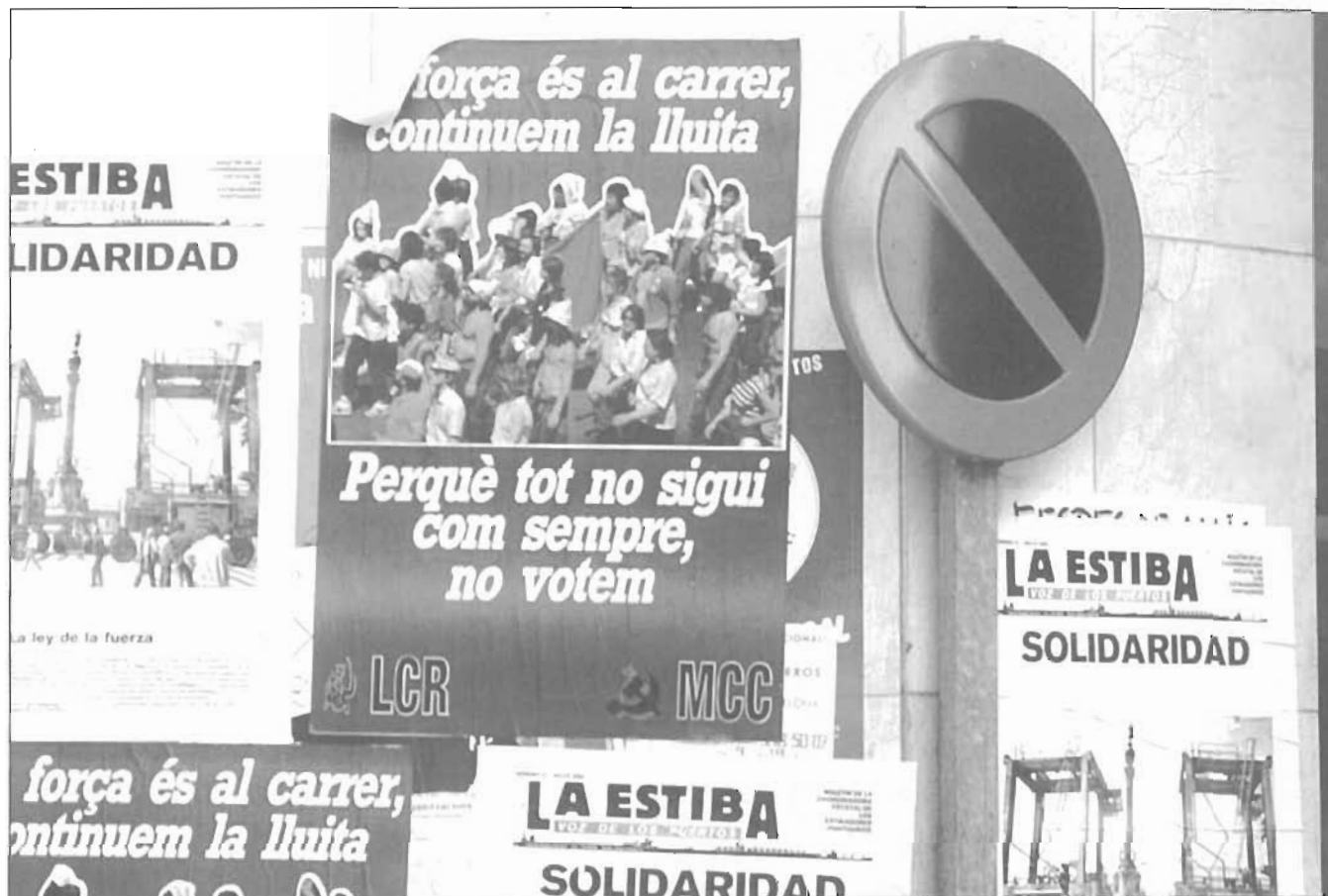
Hi han murs estratègics que, per la seva visibilitat, són aprofitats per a campanyes diverses.