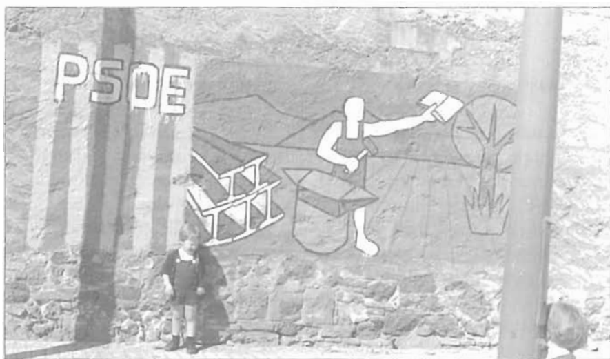
Els grans murs de les fàbriques servien per fer-hi murals, alguns força estètics.