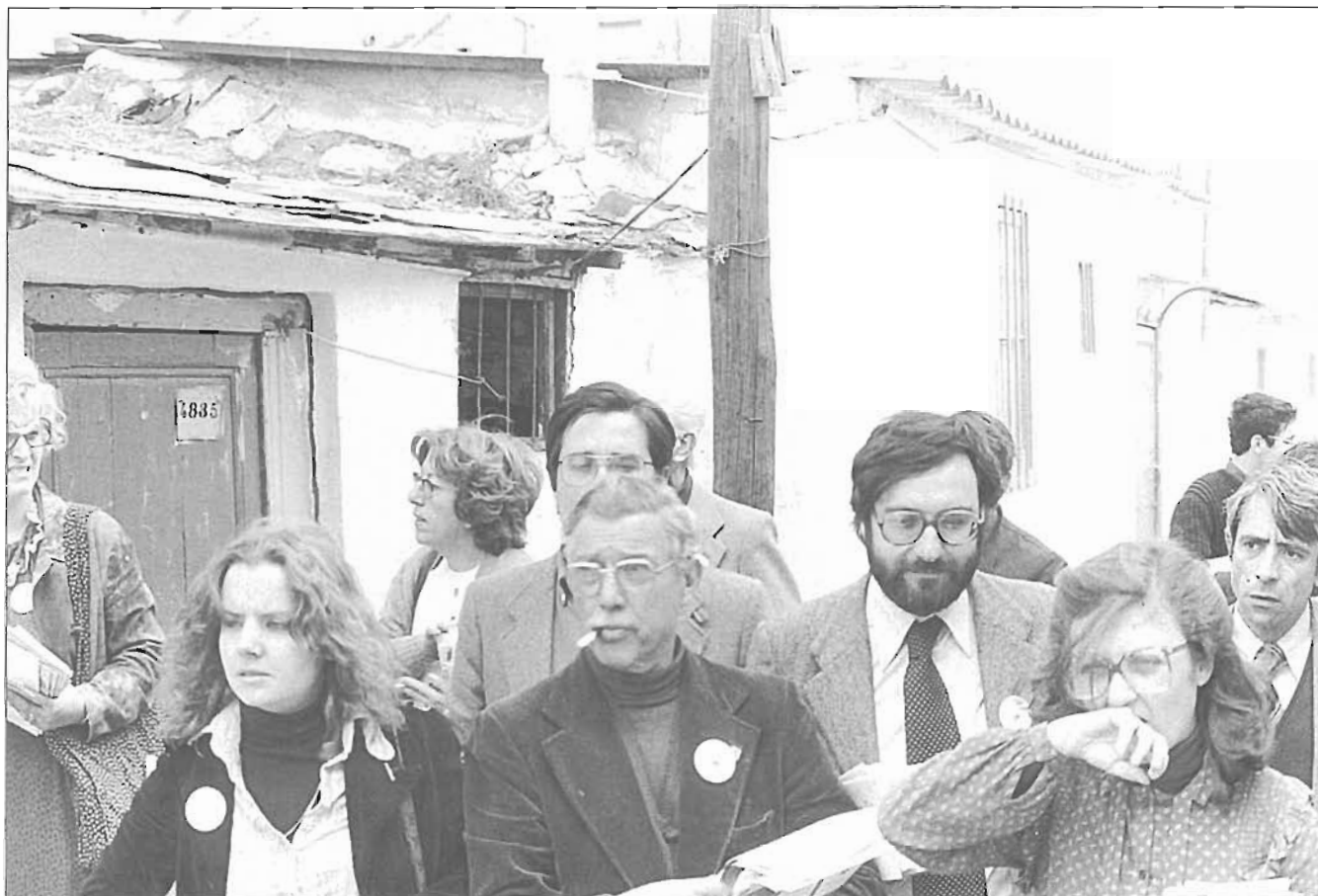
El candidat socialista a l'alcaldia de Barcelona l'any 1979, Narcís Serra, fa campanya a les barraques del Transcendentiri.

l'any 1983), Clos (11.656 l'any 1999) i Pujol (10.775 l'any 1986). En vint-i-cinc anys, el PSC ha sumat més de 10.000 vots de poblenovins tretze vegades i CiU, dues.