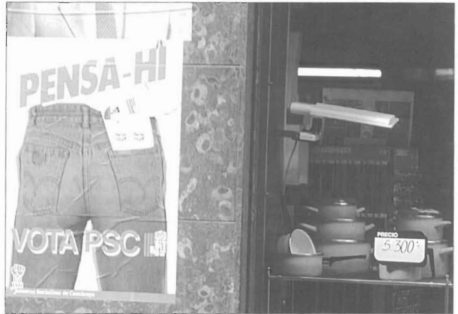
Campanya en la qual s'evitava el rostre del candidat, per mostrar una altra cara. (AHPN)

oscil·la entre el 25 i el 30 % de l'electorat.