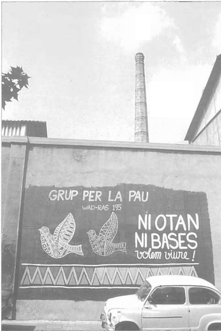
La paret de la fàbrica de les Culleres, Can Ribera, fou utilitzada pel Grup per la Pau en la seva pintada contra l'OTAN.

tre set i vuit punts per sota de la mitjana de Catalunya. Un cas paradigmàtic: la Vila Olímpica vota socialista, per no dir Maragall. A les autonòmiques del 1999, a la zona estadística municipal dels voltants de la rambla del Poblenou, Jordi Pujol va tenir 2.213 vots i Pasqual Maragall, 1.751. A la Vila Olímpica, Maragall en va recollir 1.412 i Pujol, 814.