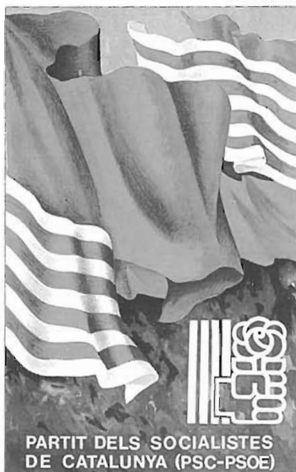
Carnet d'un militant de l'agrupació socialista de Sant Martí l'any 1980.

Per la seva banda, Esquerra Republicana de Catalunya, que en aquells moments encara era un partit il·legal, es va presentar amb el nom d'Esquerra Catalana, juntament amb el Partit del Treball, i només va obtenir un modest 8 %. És a dir, entre les forces d'esquerra sumaven gairebé dos terços dels vots emesos al Poble nou.