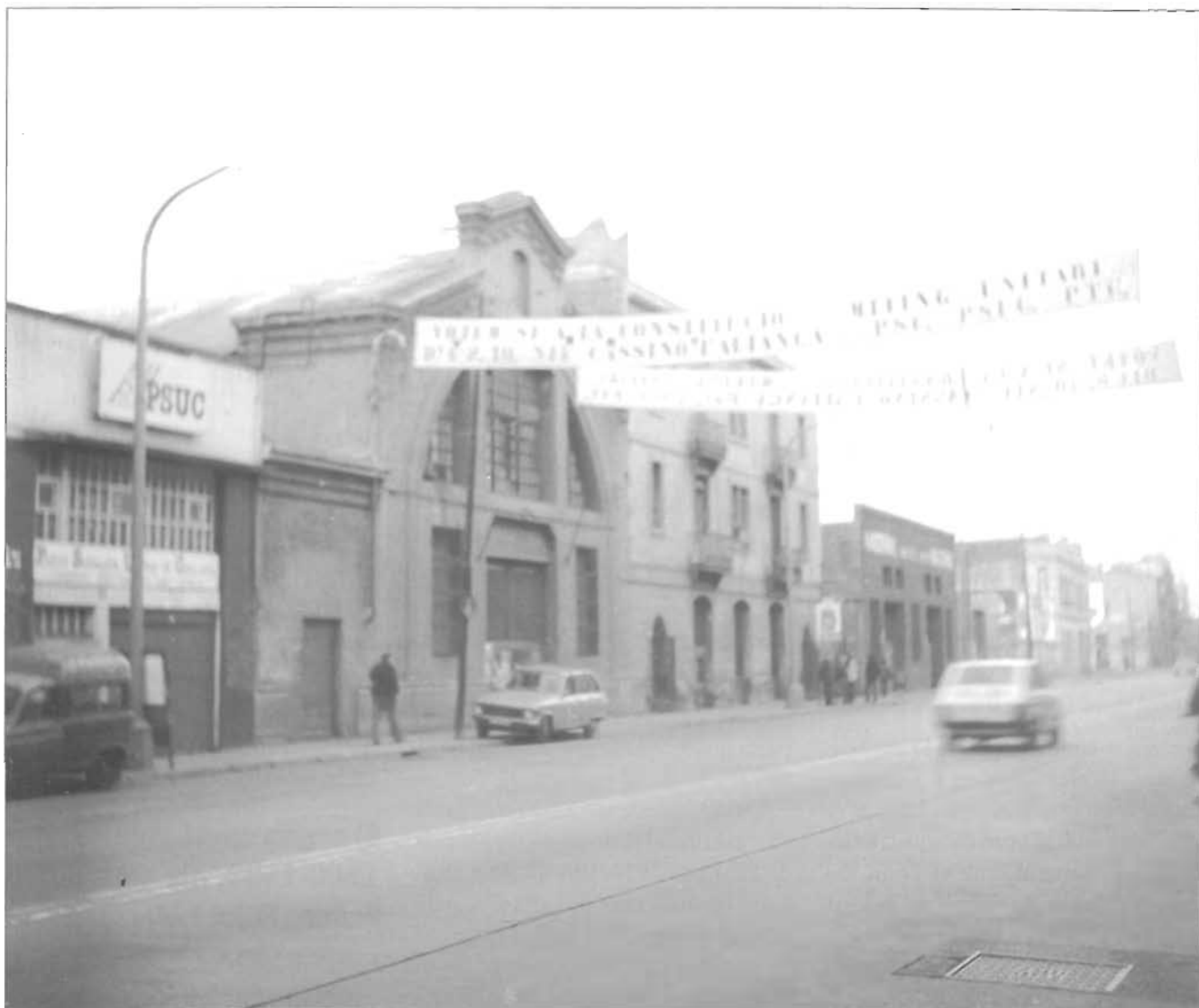
El local del PSUC al carrer Pere IV, el desembre de 1979.

ces Polítics; els primers mítings dels partits polítics, que encara eren il·legals; l'aparició de l'Avui , el primer diari en català; la celebració de l'Onze de Setembre a Sant Boi de Llobregat, etc. Cal recordar que aquest procés polític, l'anomenada Transició, també va estar marcada per l'actuació dels grups terroristes tant de dretes—cal recordar la matança d'Atocha—com d'esquerres —les actuacions d'ETA i del GRAPO. Malgrat tot, el desembre de 1976 es votava en un referèndum la possibilitat de tirar endavant la tan esperada reforma política: la victòria del sí—tot i l'alta absència a Catalunya, el 26 %— va fer