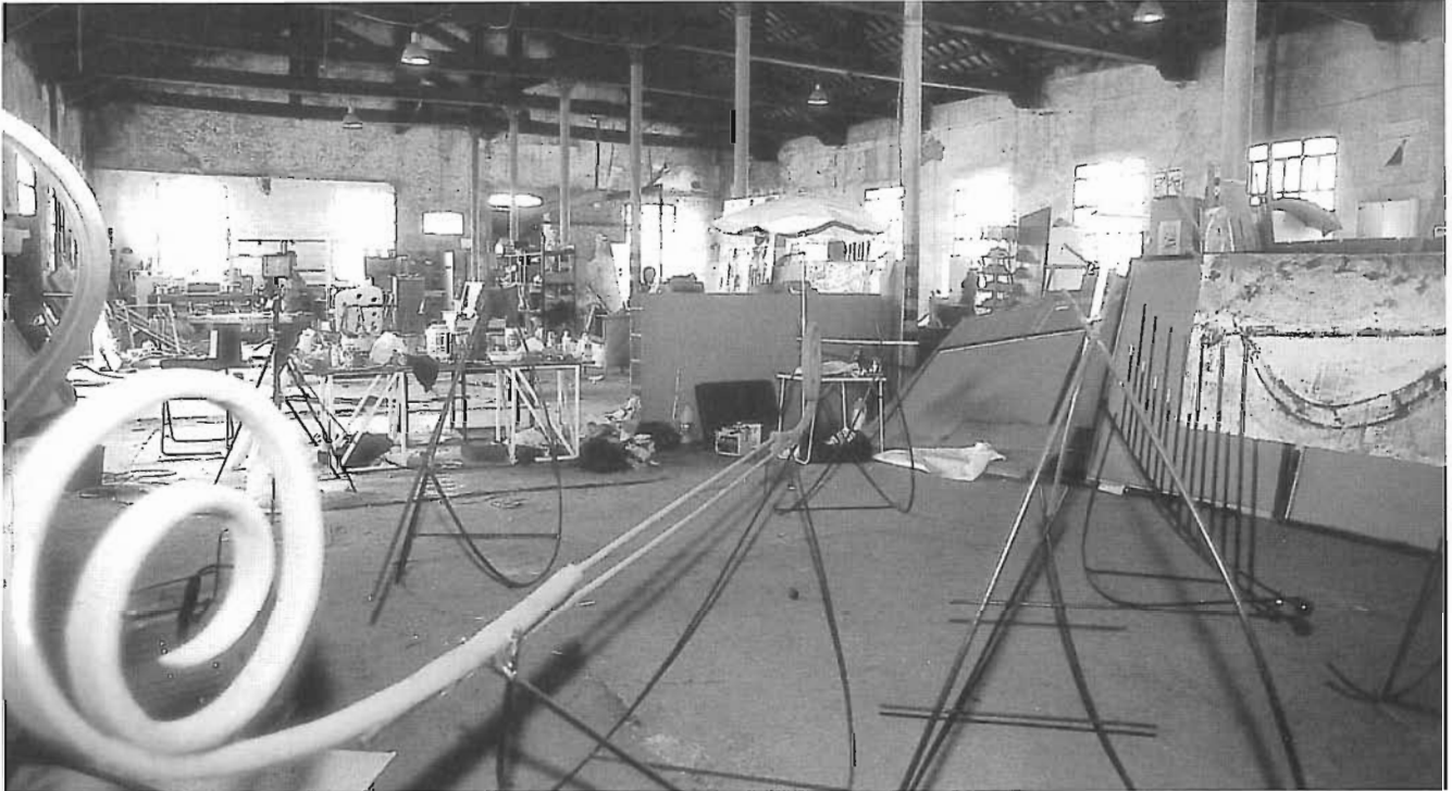
Vista parcial d'una de les dues naus que ocupaven els tallers de Palo Bajo.

edifici de patrimoni municipal. En l'etapa Bohigas (1992-1995) es dediquen a buscar edificis a Barcelona: la Fàbrica Bruguera (Parc Güell), les plantes baixes que es construeixen a Ciutat Vella de protecció oficial, al Convent de la Misericòrdia (dins del nucli neuràlgic del CCCB i el MACBA), la fàbrica Fabra i Coats, etc. Sistemàticament, es troben amb un problema: la revalorització i el canvi de fisonomia de Ciutat Vella per part de les autoritats, per tal de transformar-la amb el nucli cultural de la Barcelona contemporània. Finalment, l'any 1996, s'instal·len al Poblenou: l'Associació entra en contacte amb el propietari de Santa Isabel (antiga fàbrica tèxtil), el Sr. Federico Ricart, amb l'objectiu de llogar -per sota dels preus del mercat- un dels immobles del complex industrial en