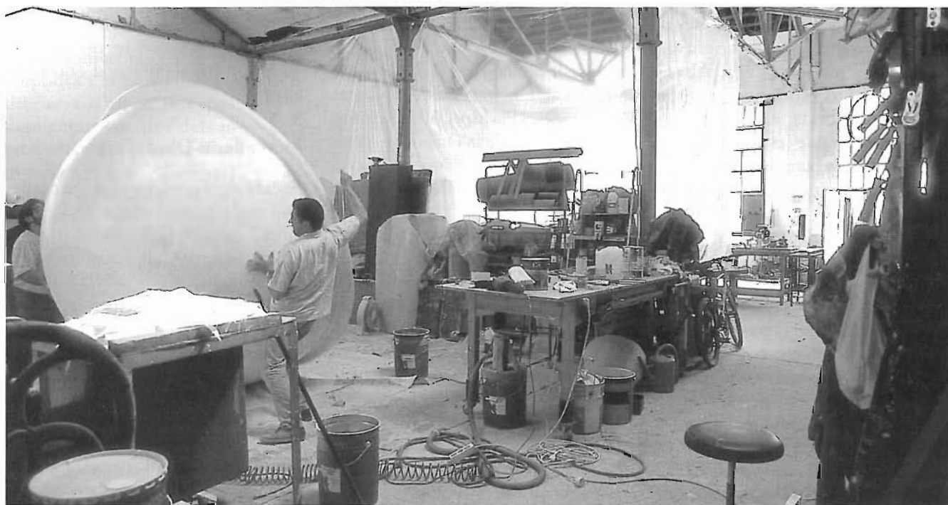
El Local 22a, un antic magatzem de paper, no sols ha esdevingut taller d'artistes, sinó un espai de discussió i debat entorn de l'art actual.

Dins d'aquest mateix local, a banda dels tallers artístics, també hi ha un petit espai d'exposicions de 70 m 2 (espai 22a), dedicat a la motivació de la creació i a l'experimentació de l'art contemporani. Està gestionat i organitzat per quatre membres del taller, amb la col·laboració de comissaris artístics, per als quals es va celebrar