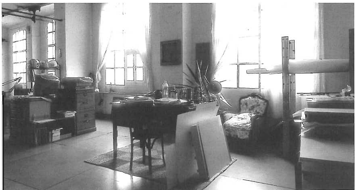
L'ambientació anglesa d'aquets despatx d'un fotògraf, situat dins d'una nau del cl. Juncar, contrasta amb els tallers dels artistes emergents, mentre que el primer viu de la fotografia, els altres no viuen de l'art.

La formació de l'artista: seminaris, cicles de conferències, etc., i les relacions amb el context sociocultural del Poblenou: Centre Cívic Can Felipa, Tallers Oberts Poblenou, escoles públiques (jornades de portes obertes per a professors i escolars d'ensenyament primari, etc.). Efectivament, tenen moltes ganes d'establir vincles amb el barri, no volen ser quelcom aïllat. De fet, l'any passat ja es van implicar en les prime-