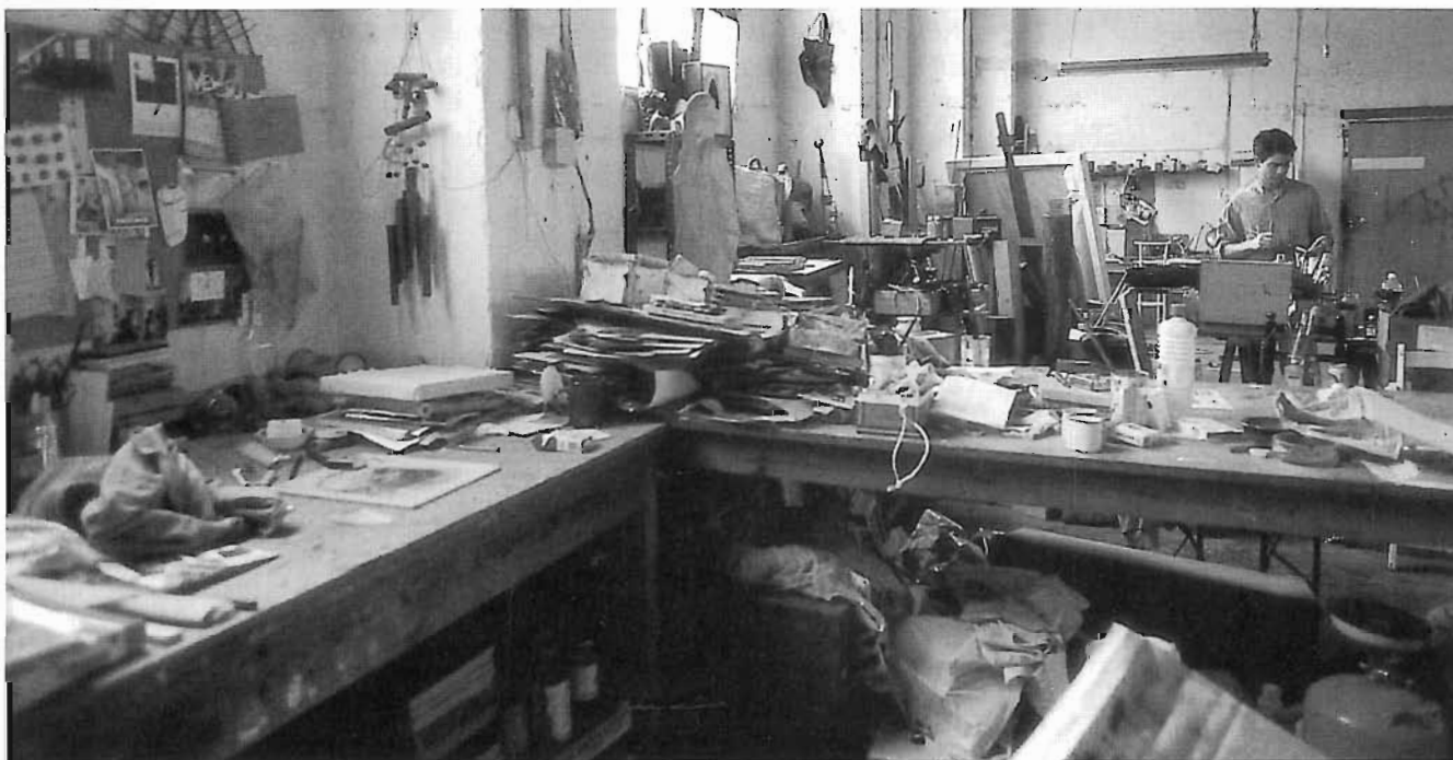
Racó de treball d'un dels artistes de Palo Bajo.

están concentrats geogràficament. No cal dir que els espais no se'ls van trobar tal com estan ara. Abans d'arribar, molts estaven en un estat pèssim, molt bruts, amb les parets tacades pel fum de les màquines industrials i per la humitat. Molts artistes han hagut d'invertir mans i mànigues per instal·lar llum elèctric i eliminar goteres. Però sense desvirtuar l'ànima inspiradora que evocuen aquests espais, sense esborrar el pas del temps i l'estètica que recorda altres ambients artístics, com el SOHO, Manchester, Berlín, etc.