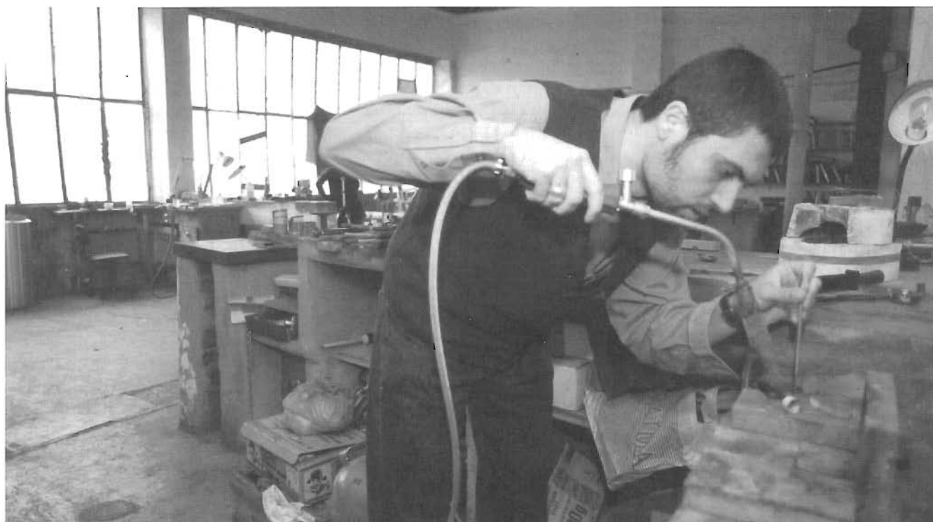
Un joier treballant al SUBMARÍ.

Com a col·lectiu fan o feien una exposició anual a la sala d'exposicions del Centre Cívic de Can Felipa. Ara, alguns d'ells estan vinculats al nou projecte d'Art públic (juntament amb alguns membres del local 22a i l'AAVC-Associació d'Artistes Visuals de Catalunya).