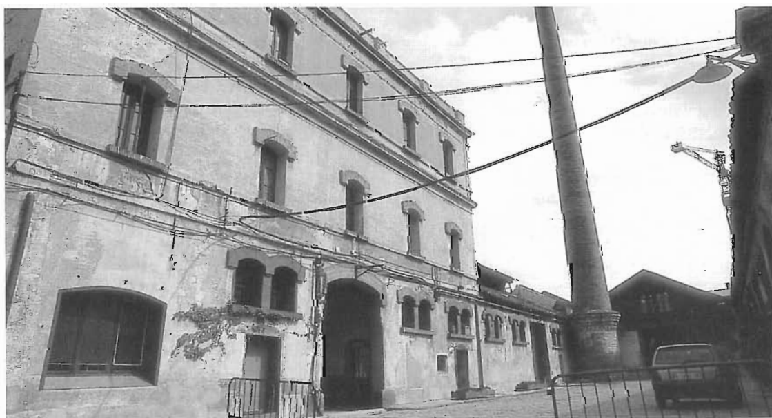
Façana de la Winchester School of Art, a Palo Alto.

En aquests últims anys cada cop hi ha menys possibilitats de trobar un