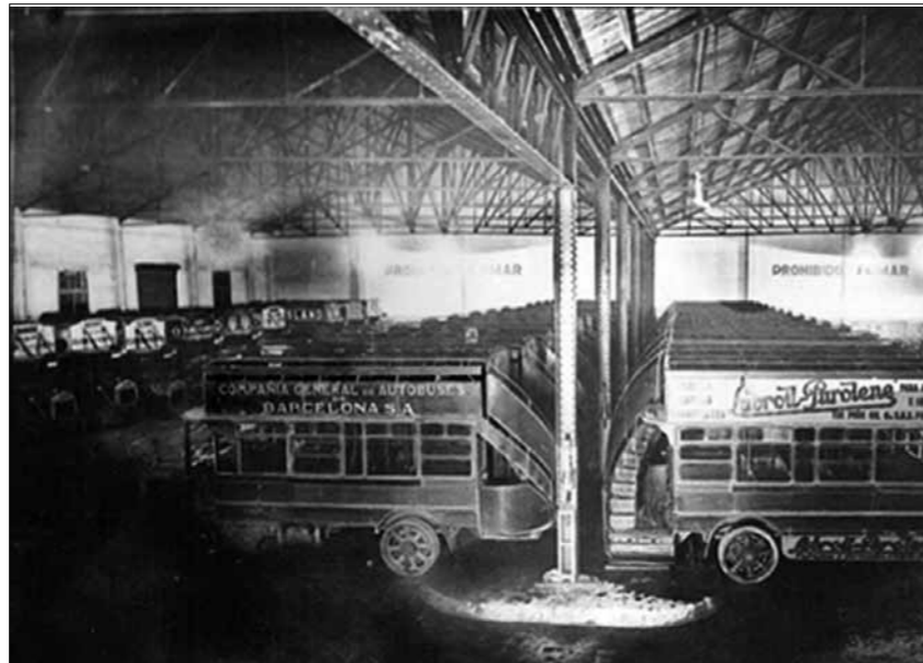
↗ → Panoràmica interior amb els autobusos a punt de servei. Poc després d'acabar la guerra civil, la cotxera construïda per la Compañía General de Autobuses (CGA) va passar a l'empresa Tranvías de Barcelona (TB). Fotos de l'any 1925 i 1941.