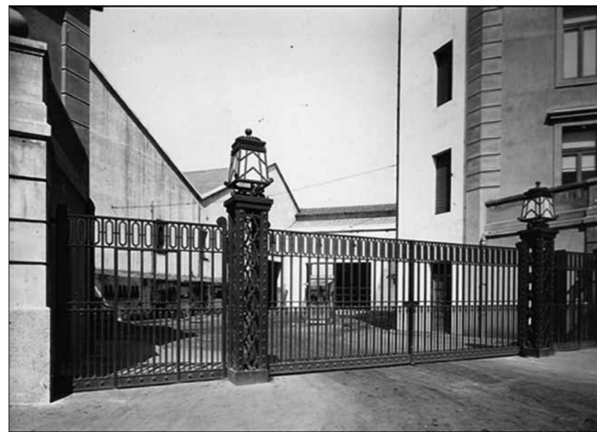
↑ ↗ Reixat de l'entrada de la cotxera art déco de l'any 1932, un canvi estilístic i de dimensió respecte a l'entrada de l'any 1924 de les naus que ocupava Aceros San Martín al mateix indret.