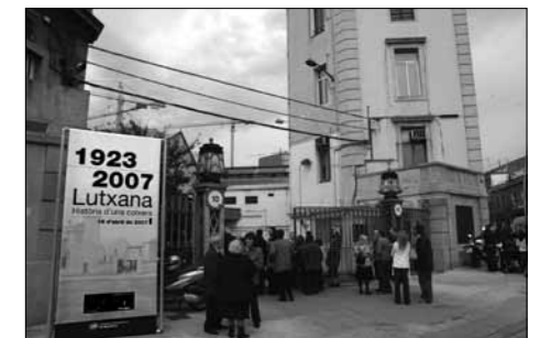
Festa de comiat de les cotxeres el 15 d'abril de 2007.