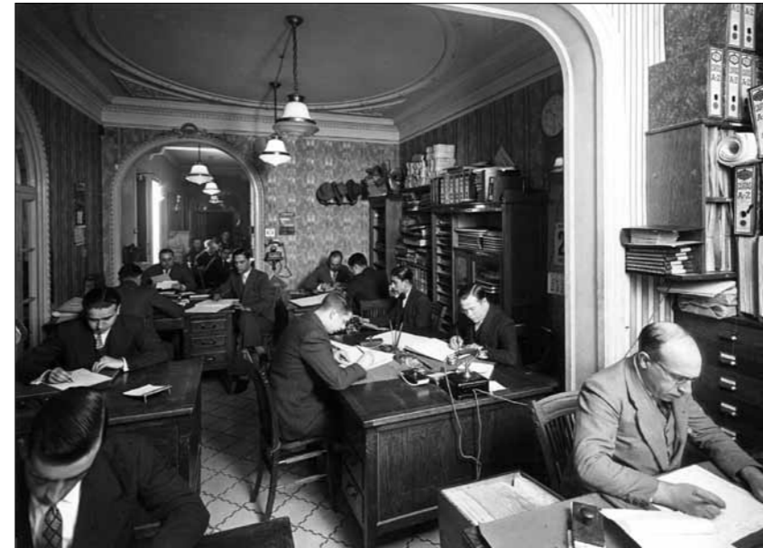
↖ ← ↙ Sales de liquidació de cobradors, procés de capacitat del personal, oficines i sales de plànols per establir recorreguts. Anys trenta.