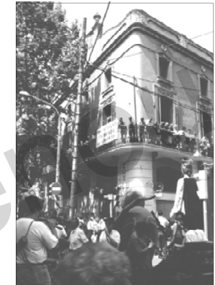
Festa en motiu de la cloenda de la C opeativa L'Artesana. 2 de juliol del 1995.