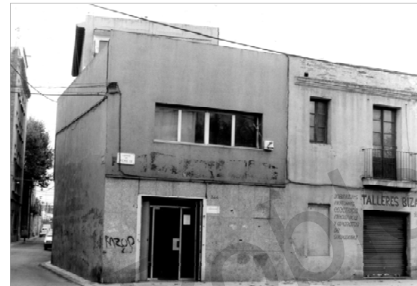
Local del carrer de Pere IV on du rant la Guerra Civil hi havia l'Ateneu l'Ibertari La Antorcha. Agost del 1999.

1934: Penya Excursionista Amistat , a Taulat, 125.