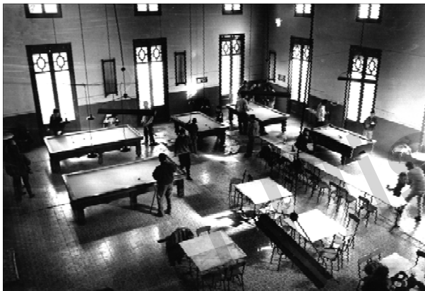
La sala de billars de la Cooperativa L'Artesana.

car i l' Agrupació Excursionista Icària disposen d'article propi):