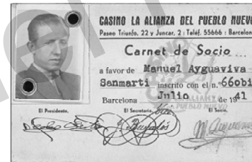
Carnet de soci de l'Aliança del Poblenou. Any 1941.