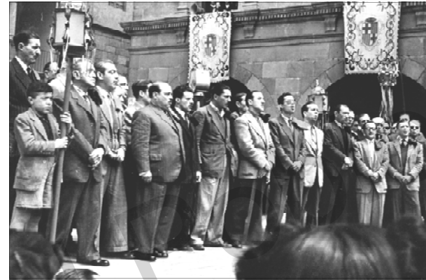
El Cor de l'Artesana cantant a la plaça Major del Poble Espanyol. Any 1945.

La Cosmopolita , a Pujades, 91 (1908). El Jardí, que es trobava al carrer de Roc Boronat, 23, i que va funcionar del 1909 al 1928, quan va ser absorbida per La Flor de Maig 3 , la cooperativa més important del barri, de la qual parlem en un treball a banda. Al mateix local d' El Jardí es va instal·lar el