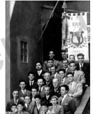
L'Orfeó Virolai al pati del Centre Moral. Any 1952.

Pau i Justícia va ser, després de La Flor de Maig, una de les cooperatives més conegudes del Poblenou. La van crear el 1899 setze treballadors, raó per la qual va ser coneguda als seus inicis com "la dels Setze". 4 Va ser una de les que va esperar la creació d'un subsidi d'invalidesa laboral en uns temps que no hi havia cap mena de seguretat social per als treballadors amb problemes. Va aixecar un nou local al carrer de Pere IV el 1910, i el va ampliar, tal com subsistia, el 1924. Va