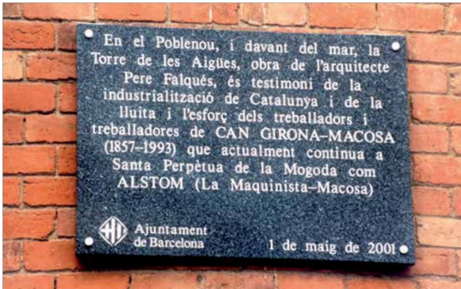
Placa afixada a l'exterior de la Torre de les Aigües en record de Can Girona i dels seus treballadors.

L'objectiu d'aquest article és explicar els darrers anys de la fàbrica Macosa des d'una perspectiva sindical tal com jo vaig viure aquells temps de lluites. Macosa ha estat molt important per a la indústria, però encara molt més com a referència i símbol de la lluita dels treballadors i de la història del moviment obrer català.