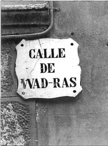
Un tram del carrer de Wad-ras era, i és, el barri de la Plata

rrer Pellaires, un camp de futbol — que en deien del Smoking i després de la Guerra Civil fou rebatejat amb el nom de camp del Joventut.