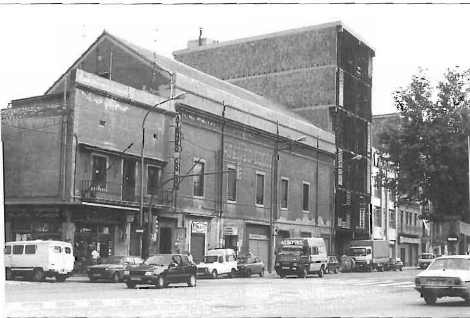
Darrere de l'Ateneu Colón hi havia l'indret de la Granota