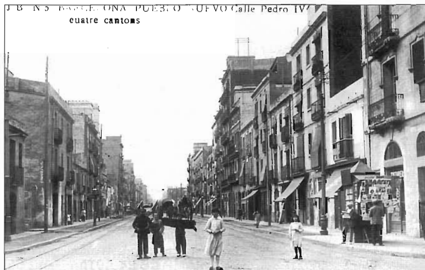
Prop dels Quatre Cantons, el 1915