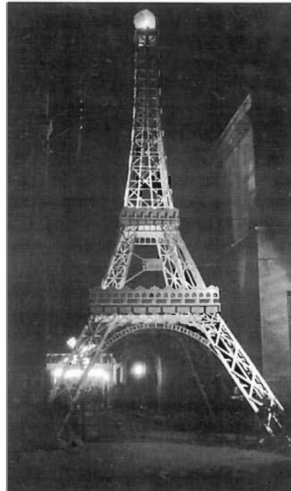
Pge. Cadena (General Bassols) Premi al millor carrer guarnit. Any 1954

Abans de la guerra era conegut com el Camp del Sidral un descampat proper a la plaça de les Glòries, on