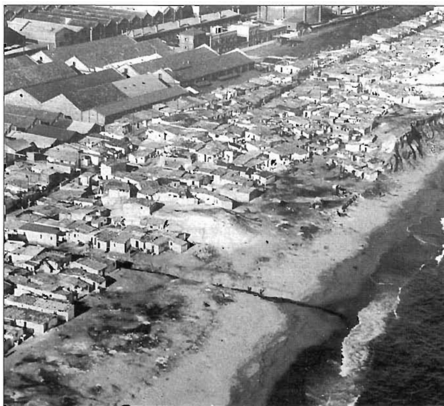
El Somorrostro des de l'aire. Anys seixanta