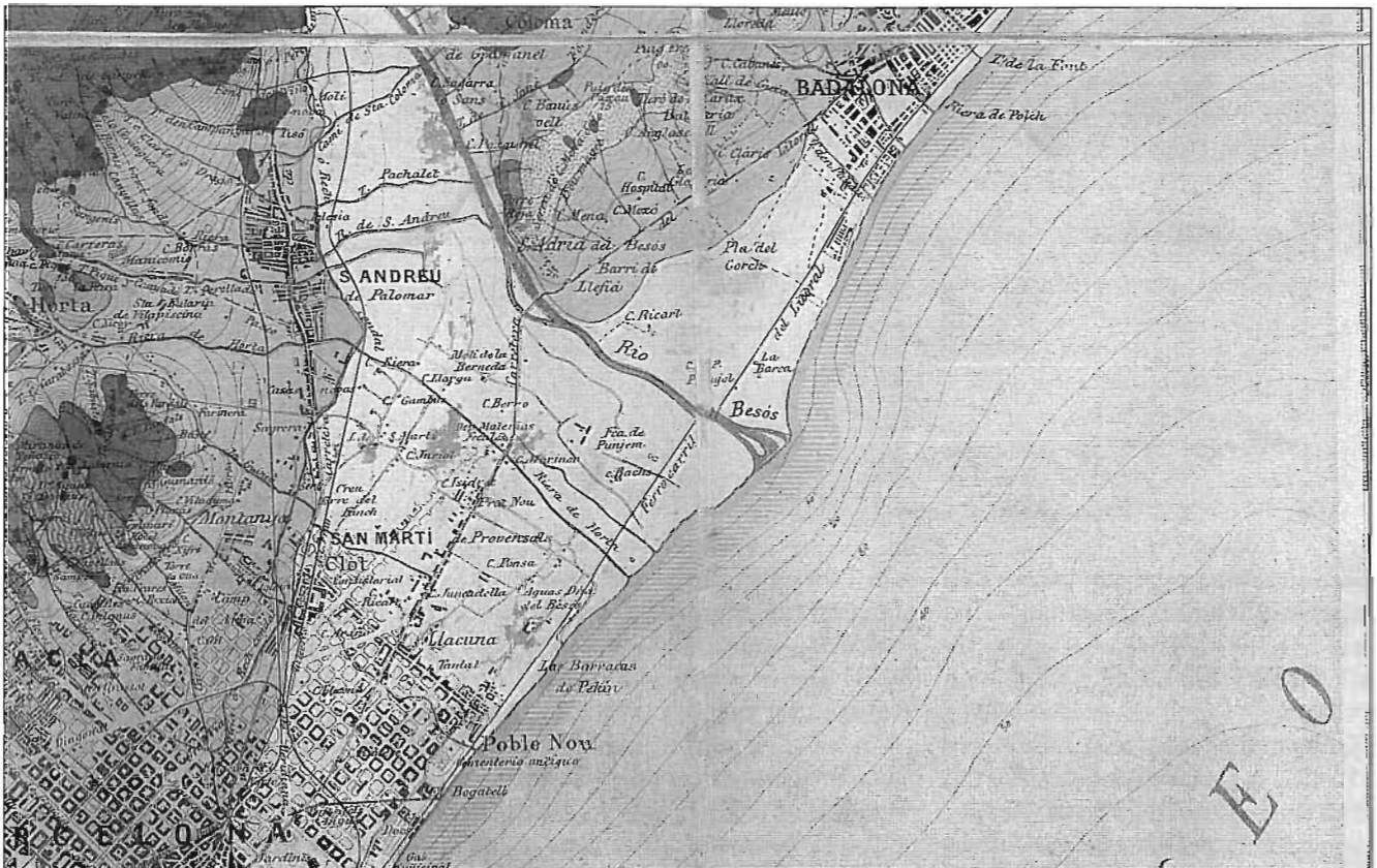
Plànol del Poblenou (1900) on s'hi reflecteixen els topònims de Taulat, Llacuna i Pekín

Una de les característiques del saber històric és la científicitat de les proves, és a dir, la necessària comprovació de la veracitat de les proves que donen forma a la història. Sense proves ni fets no hi ha història, però si no comprovem l'autenticitat d'aquestes proves —ja siguin orals, escrites o iconogràfiques— la possibilitat de falsejar la història esdevé una realitat.