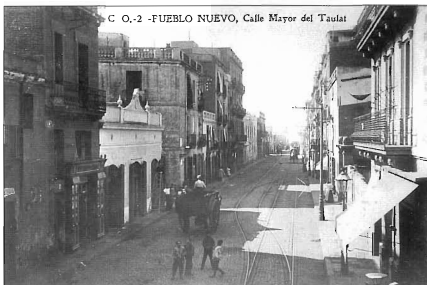
El carrer Major del Taulat, el 1909