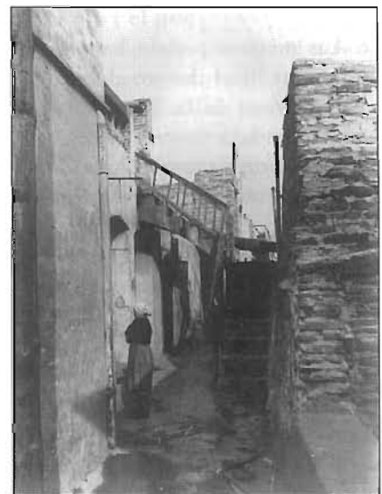
El complicat urbanisme d'un barri humil, 1946.

Ella mateixa va explicar posteriorment que «nací a la orilla del mar» per desfer la llegenda que havia nascut al barri granadí de Sacromonte. El temporal al qual al·ludeix el biògraf de l'Amaya no és tan sols un recurs literari. Durant anys el gran enemic del barri van ser les tempestes de tardor i hivern.