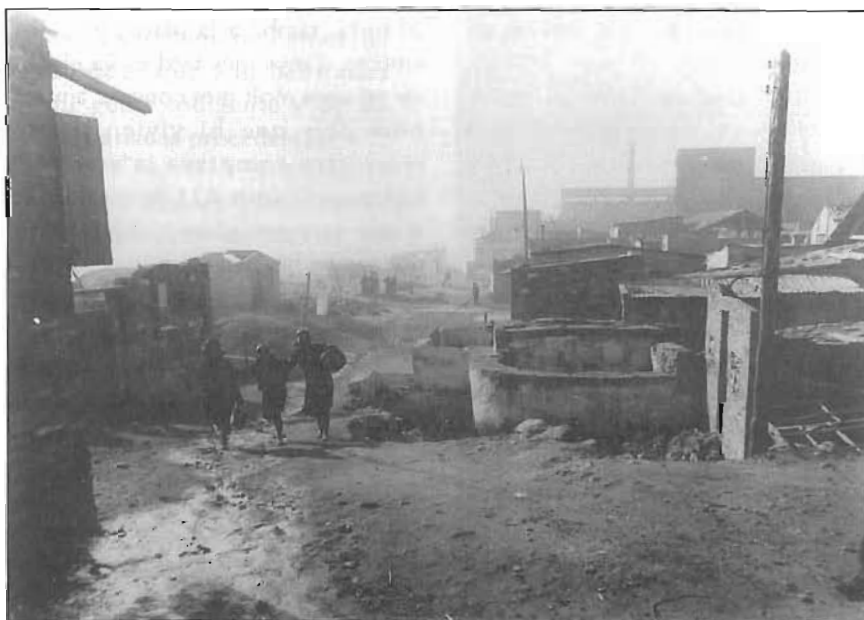
La part baixa del Somorrostro vista des del Turó, 1916

El 1951 la ballarina Carmen Amaya, que hi havia nascut, va tornar al seu barri per primera vegada des que va acabar la Guerra Civil i va quedar sorpresa per la transformació: