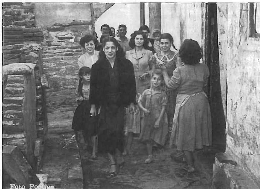
Carmen Amaya visita l'any 1951 el barri on va nèixer.

El 1966 desapareixia en poques hores un barri de barraques que va existir entre la Barceloneta i el Poblenou. El Somorrostro, una de les vergonyes de la Barcelona del "desarrollismo", és recuperat de la memòria en aquest article de Josep Maria Huertas.