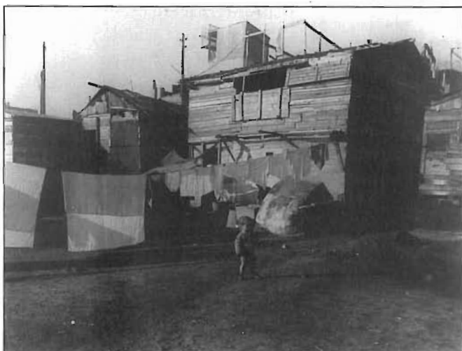
Casa de fusta d'una família de mariners, 1916.

«En el sitio denominado Somorrostro fué detenido un sujeto que llevaba un saco con prendas de ropa.» 3