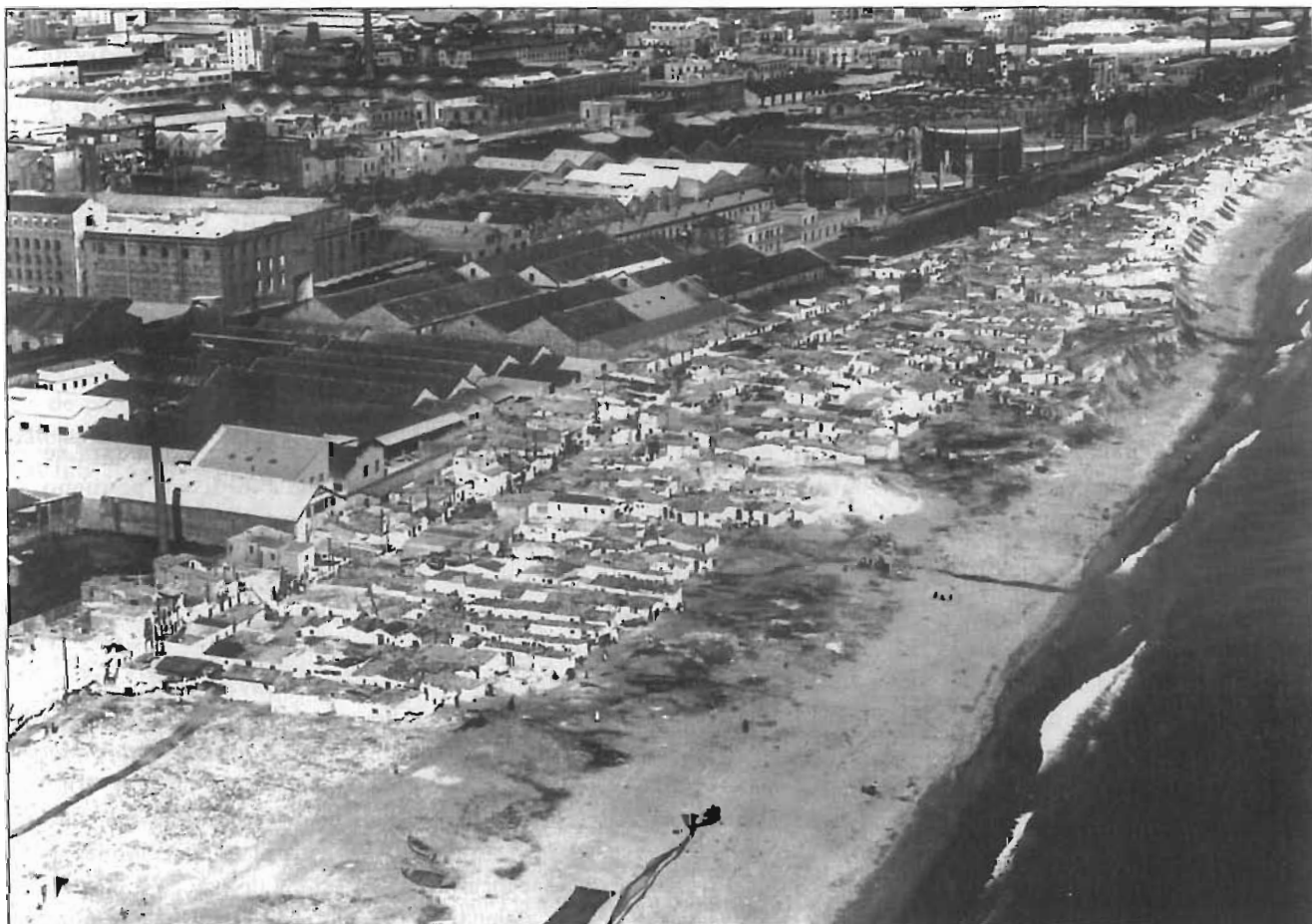
Perspectiva aèria del barri del Somorrostro.

de les aigües. Dos anys més tard, el destí provisional de les víctimes dels elements seguia sent l'estadi. 17