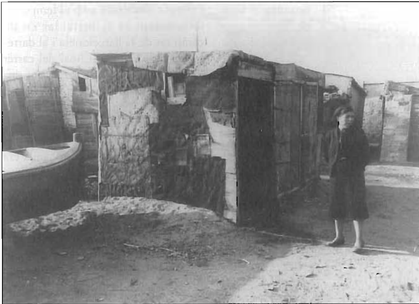
Casa de pescadors a la platja, 1946.

«...abans, des d'aquí estant, es veia el mar... —mormolà. Quan habitava allí, el carrer major del Somorrostro només tenia construït un costat. Posteriorment, el barri havia multiplicat el cens i no va restar un pam de sorra sense la barraca corresponent.» 5