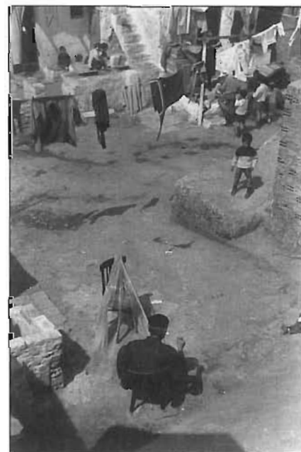
Un vell sargeix la xarxa mentre pren el sol, 1965.

Rafael Hinojosa, avui diputat per Convergència i Unió al Parlament de Catalunya, va viure com un nen emigrat des de Cabra (Còrdova) a final dels anys quaranta i recorda que habitaven en una barraca d'una sola